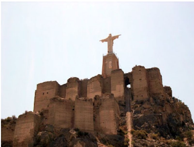
CASTILLO DE MONTEAGUDO, RESIDENCIA DEL REY LOBO