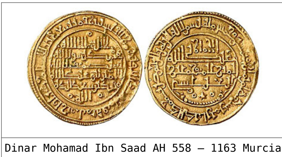
Dinar Mohamad Ibn Saad AH 558 – 1163 Murcia

como el cristiano Rodrigo Díaz de Vivar, el “ Cid Campeador ” lo fue frente a los almorávides en la centuria anterior. En palabras del historiador español Claudio Sánchez Albornoz, el rey “lobo” luchará por un territorio, para él, patria común de los hispanos, indistintamente del credo que profesasen. Admirado y temido por sus enemigos por su valor, arrojo y astucia, convertirá a “ Mursiya ” (Murcia), en la capital del mundo andalusí durante los segundos reinos de “ taifas ” y permanecerá insumiso hasta su muerte.