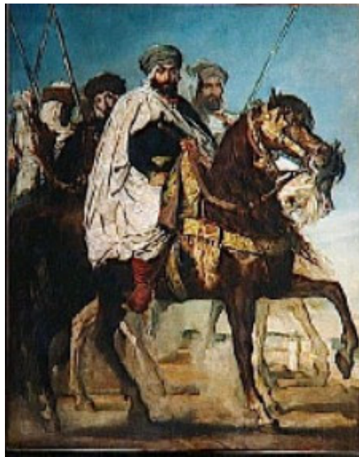
El rey Lobo

estructura de poder, aplastando cualquier iniciativa nacionalista andalusí.