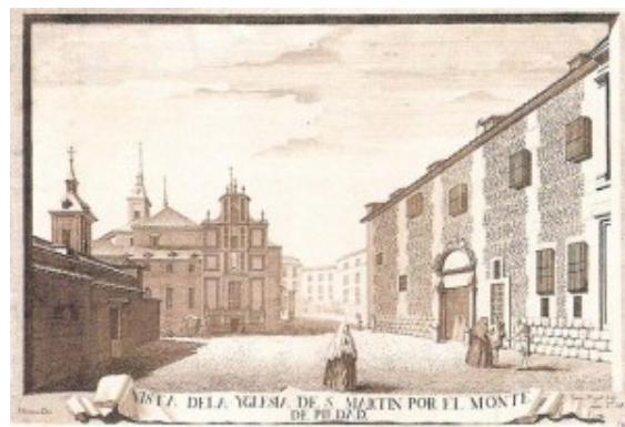
iglesia de San Martín- dibujo de Juan de Villanueva