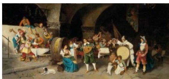
taberna siglo de oro-Luis Ricardo Falero – La Fiesta en la taberna (1880)

Madrid, detrás de la Iglesia de San Nicolás, junto a la Plaza de Antón Martín. Va enseguida a la taberna de Ana en la calle de Tudescos. El establecimiento está siempre muy animado y don Miguel acude con frecuencia y llena de versos y frases amables a la tabernera, amistad que se ve afianzando y cada vez mas íntima debido además a la ausencia del marido por sus frecuentes viajes.