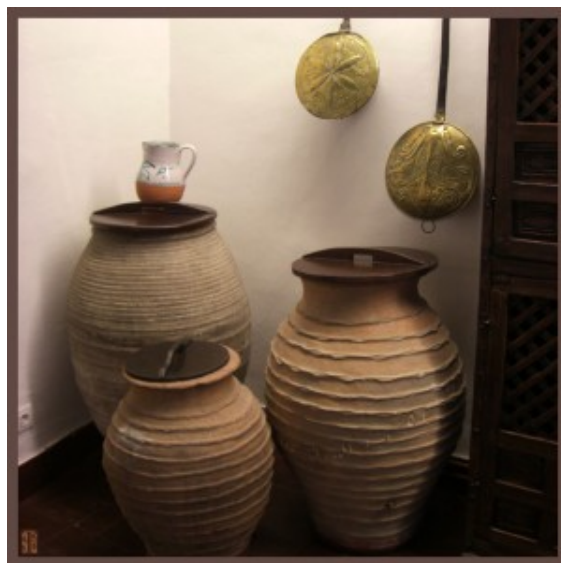
Casa de Cervantes-Cocina- Valladolid