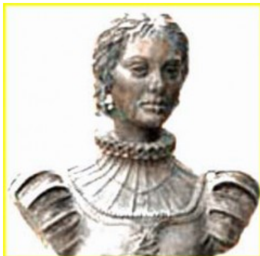
Busto de Catalina de Salazar