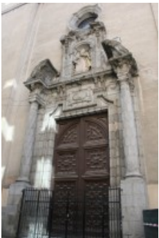
Portada iglesia de san Luis adosada a la iglesia del Carmen

cuarto. Era allí donde Ana y Miguel celebraban sus encuentros amorosos. El escritor Luengo en su obra "Catalina de Esquivias" refiere que Cervantes se reunió con su librero Blas de Robles en la taberna , ya en tratos para editar La Galatea y que entre trago y trago le pagó mil trescientos treinta y seis reales y así entre copa y copa llegó a estar en estado catastrófico. La tabenera,