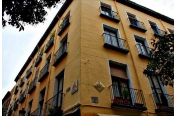
Casa sobre la que se alzó el Mentidero de Representante