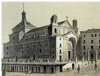
Mentidero de San Felipe

Miguel es escritor y quiere hacerse valer. En ese Barrio Madrileño hay dos puntos de encuentro para los literatos. Uno son las Gradas de San Felipe, a la entrada de la Calle Mayor y otro, el más popular, el “Mentidero de Representantes” o “Lonja de mercaderes” en calle León, junto a la del Prado, donde se reunían escritores, artistas, cantantes, bailarinas, gente de teatro, siempre con la esperanza de encontrar un papel o representación teatral. En las proximidades había tabernas en las que el vino, el buen humor y el deseo de felicidad lograban veladas inolvidables muchas veces ilustradas por las atractivas mujeres de la “mancebía” de calle de Francos. Allí bullía una preciosa chiquilla de poco más de quince