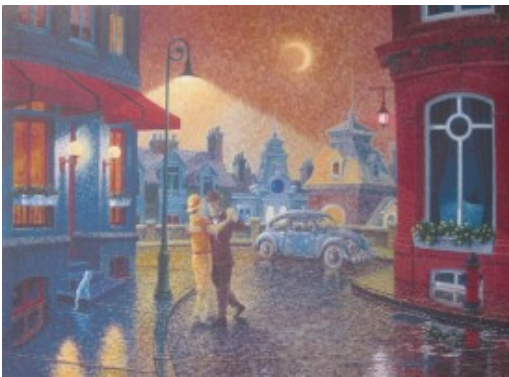
Tango en París