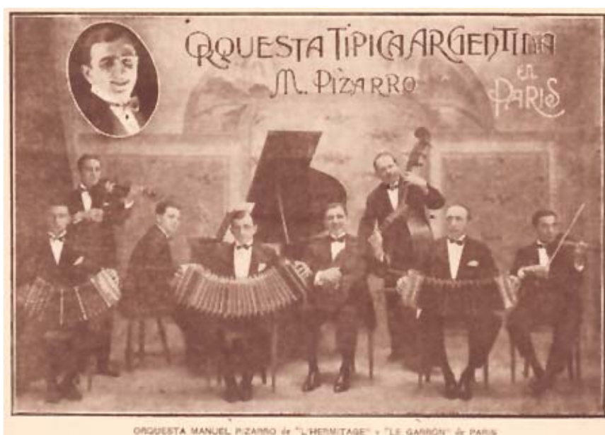
Orquesta Manuel Pizarro

vestidos de gauchos ante príncipes, maharajas y artistas como Rodolfo Valentino, el pianista Arturo Rubinstein o el violinista y aficionado milonguero, Jascha Heifetz. Por esos días y vecino al Florida existía el teatro Le Perroquet, donde el Tano Genaro conducía su orquesta y entre las matinées llamadas thés-tango brillaban el Claridge Hotel y el Ermitage de Champs Elysées. Además del emblemático restaurant El Garrón, de un argentino y sede estable de la orquesta de Manuel Pizarro donde se bailaba hasta la madrugada, igual que en el dancing Capitol, cuya orquesta típica recibía a insomnes calaveras hasta la media mañana.