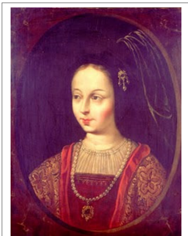
Retrato de Beatriz Galindo

Beatriz Galindo fue la primera profesora de la historia de España, a pesar de nacer en el siglo XV y de su condición de mujer consiguió hacerse un hueco dentro del reducido grupo de féminas que se dedicaban en la época a estas profesiones. Una de sus mayores logros es haber conseguido entrar dentro del selecto grupo de humanistas que forman parte de la historia compuesto mayoritariamente por hombres.