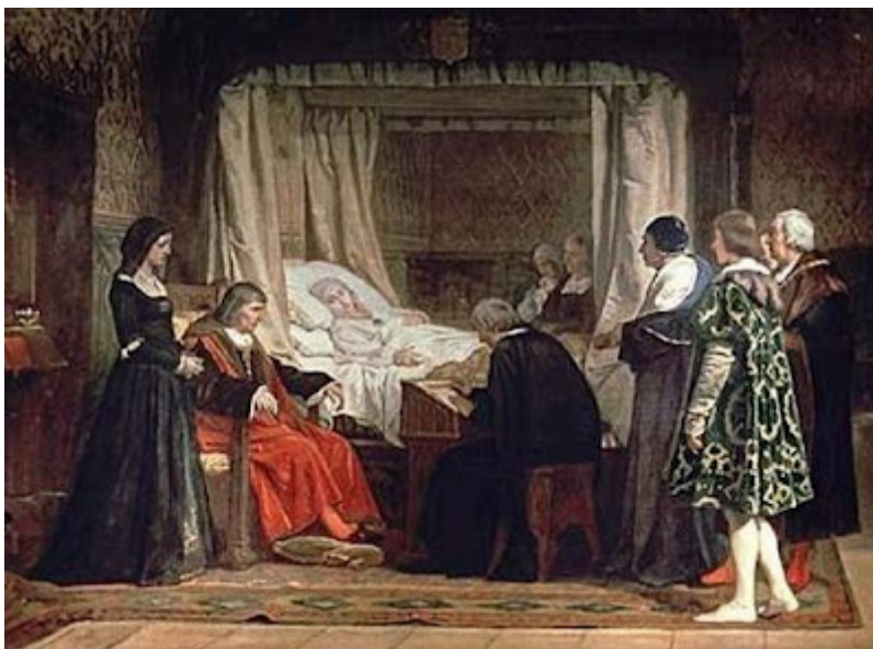
Testamento de Isabel la Católica. Cuadro de Eduardo Rosales, Museo del Prado, Madrid. Betariz es la mujer que está en pie junto a Fernando el Católico.

Durante su aprendizaje mostró grandes dotes para el latín, tanto escrito como traducido y en lo que más sorprendió fue en su capacidad para hablarlo.