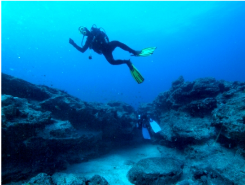
BUCEO BAJO LAS AGUAS DE FUERTEVENTURA

Bajar a las profundidades en las aguas de Fuerteventura es tener la sensación de un momento mágico. Sus aguas cristalinas invitan a quedarse inmersos en el mundo de Poseidón, recorriendo los ríos sumergidos de lava, producidos por innumerables erupciones volcánicas, podríamos ver con un poco de imaginación, al Nautilus y a su capitán Nemo, o si acaso encontrarnos con los restos de alguna ciudad sumergida del continente atlante. Siempre en esas aguas, navegamos juntos a una gran cantidad de habitantes marinos.