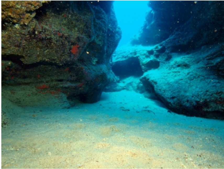
FONDO MARINO ENTRE CORRALEJO Y ISLA DE LOBOS

Sensaciones de estar rodeado de todo, porque todo te rodea.