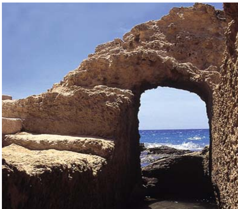
RUINAS DE LOS BAÑOS DE LA REINA

asentamiento de numerosas civilizaciones. El emblemático Peñón de Ifach ha servido de protección para diversas culturas y en sus faldas se han encontrado restos de la época ibérica (siglos IV y III a.C.). Posteriormente, recibe las primeras visitas romanas, de cuya época se pueden contemplar los Baños de la Reina, una piscifactoría o fábrica de salazones que rememora la época en que Calpe se dedicaba al comercio y a la industria de la salazón de pescado.