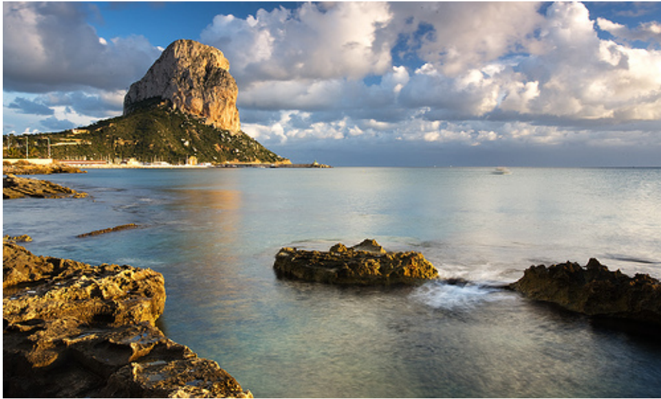
VISTA GENERAL DEL PEÑÓN DE IFACH

El término municipal se extiende alrededor de una bahía en cuyo extremo norte se eleva el Peñón de Ifach (332 m.). Declarado Parque Natural en 1987 (en época estival tiene una regulación de visitas), se adentra en el mar hasta la punta del Carallot, pudiéndose ascender hasta su cumbre siguiendo el itinerario habilitado.