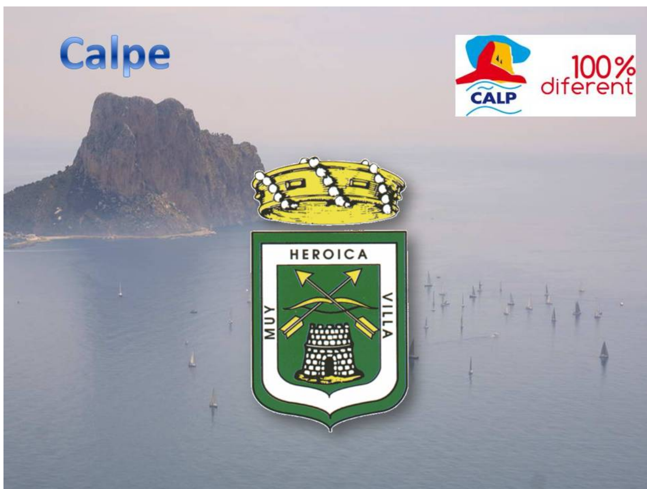
ESCUDO DE CALPE

Calpe es una hermosa Villa abocada al mar, situada al norte de la provincia de Alicante. Su ubicación al sur de la Comunidad Valenciana y la templanza del mar, le proporcionan una suave temperatura a lo largo de todo el año.