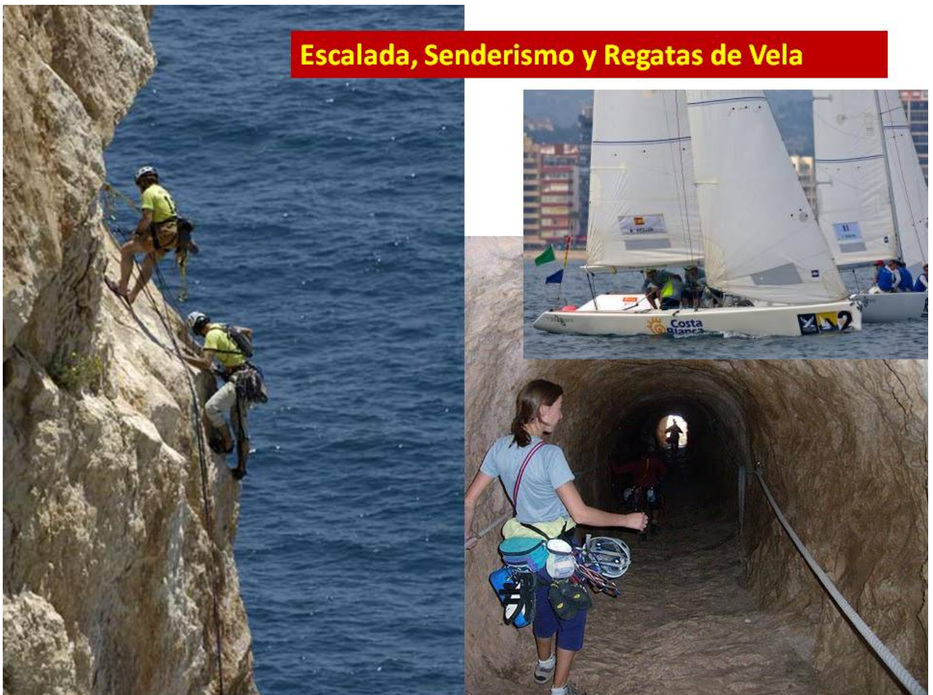
Escalada, Senderismo y Regatas de Vela

Disfrute a lo largo de todo el año del rastro -miércoles- y el mercadillo semanal -sábados-. En época estival suele tener lugar una Feria de Artesanía en el casco antiguo, así como un mercadillo nocturno en la playa del Arenal-Bol.