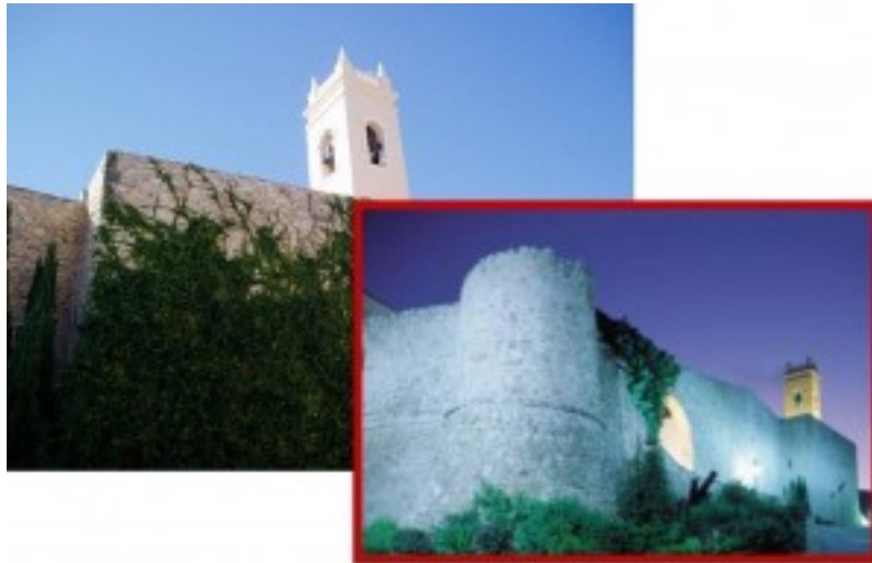
MURALLAS DEL CASTILLO Y TORRE DE LA IGLESIA

En el casco antiguo se mantienen los restos del “Torreó de la Peça”, edificación defensiva; parte de las antiguas murallas; el “Forat de la Mar” y la Iglesia Antigua, único ejemplar de estilo gótico-mudéjar que existe en toda la Comunidad Valenciana. Se pueden visitar los museos Arqueológico, Fester, del Coleccionismo y «Casa de la Senyoreta». Por el paseo marítimo se accede a los Baños de la Reina y al Molí del Morelló.