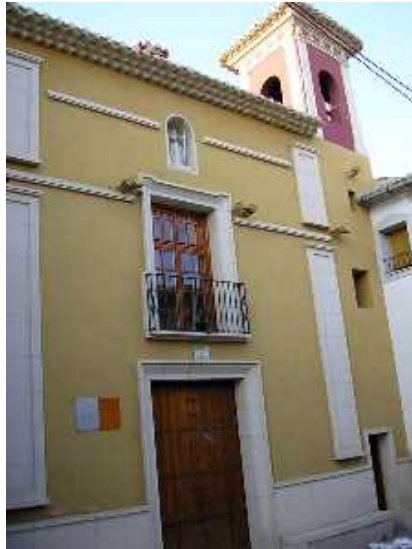
ERMITA SANTA ELENA, FACHADA PRINCIPAL,