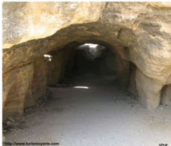
CUEVAS DEL MARQUÉS

Bello paraje situado a pocos kilómetros del casco urbano donde se encuentran los más caudalosos nacimientos de agua de la región de Murcia y una diversificada masa forestal.