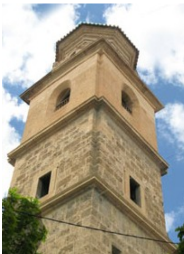
TORRE DE LA IGLESIA PURÍSIMA CONCEPCIÓN

Edificada entre los años 1534 y 1600 constituye una bella muestra de arquitectura renacentista. Sus planos se atribuyen a varios tracistas como Pedro de Antequera, Pedro Monte de Isla e incluso Jerónimo Quijano, éste último de dudosa participación, aunque su diseño se asemeja a su forma de trazar sus edificaciones: Planta de salón con esbeltas columnas de orden jónico que sostienen las bellas bóvedas de crucería. La capilla mayor exhibe el retablo barroco de José Sáez, procedente de la iglesia de la Compañía de Jesús. Los dos altares barrocos de los testeros laterales son dos bellos retablos de columnas salomónicas del siglo XVII. El edificio está declarado Monumento Histórico-Artístico Nacional desde 1983. En su exterior encontramos en uno de sus ángulos la famosa arpía con cabeza y pecho de mujer y cuerpo y garras de ave de presa, que con significado cristiano se recoge de la mitología griega. Destacan ciertas obras dignas de reconocimiento en escultura de la escuela salzillesca, como Marcos Laborda, y el más sobresaliente, Roque López. En orfebrería destaca la "Cruz Mayor" y la "Custodia del Corpus", y las rejas del magnífico artesano Ginés García de comienzos del XVII cierran algunas de las capillas laterales del templo.