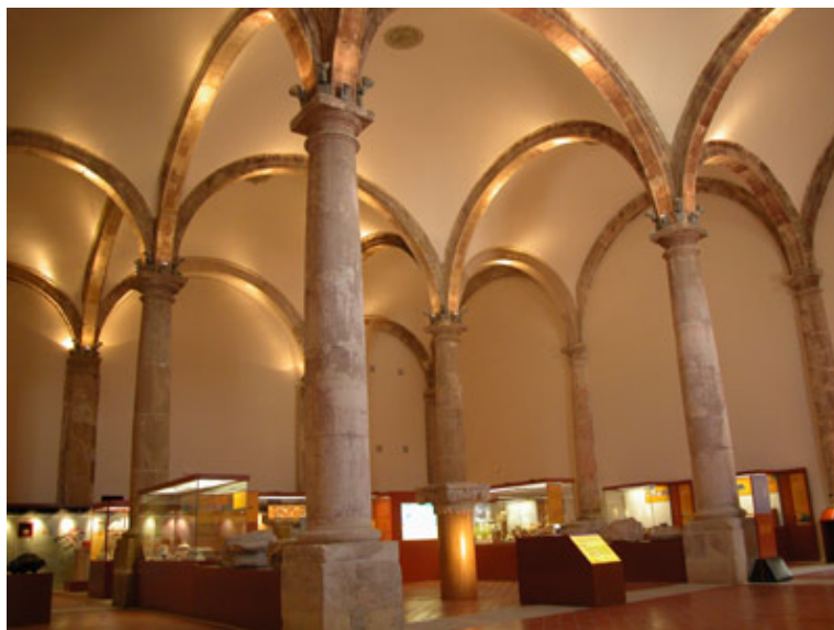
MUSEO ARQUEOLÓGICO EN LA IGLESIA DE

Preside la plaza del Arco. Es una obra barroca del siglo XVIII en cuya traza intervino el arquitecto Jaime Bort, arquitecto de la magnífica fachada catedralicia de Murcia. La fachada principal está dividida en tres cuerpos: el primero incluye el arco central que da nombre a la plaza. En el centro de la misma está el monumento al “Moro y al Cristiano”, obra del escultor Rafael Pi Belda, y cuyas obras escultóricas reconocemos en otras plazas de la ciudad.