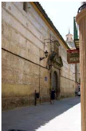
MONASTERIO E IGLESIA DE SAN JOSÉ

Fue la primera parroquia de la ciudad, construida en el interior del antiguo recinto amurallado y reconstruida posteriormente en el siglo XVI. En la actualidad se destina a Museo Arqueológico local. En su interior se exponen diversos materiales arqueológicos desde el Paleolítico hasta la Edad Media, destacando los procedentes del Complejo de la Encarnación.