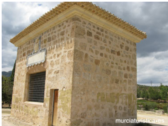
ERMITA DE LA REJA, Foto

Del siglo XVII, está ubicada junto a la típica plaza de los Caballos del Vino (conocida popularmente como plaza del Hoyo), donde se encuentra el monumento al “Caballo del Vino”. En esta ermita destaca la imagen de N o Padre Jesús Nazareno, ante la cual se realiza el solemne besapiés el primer viernes de marzo.