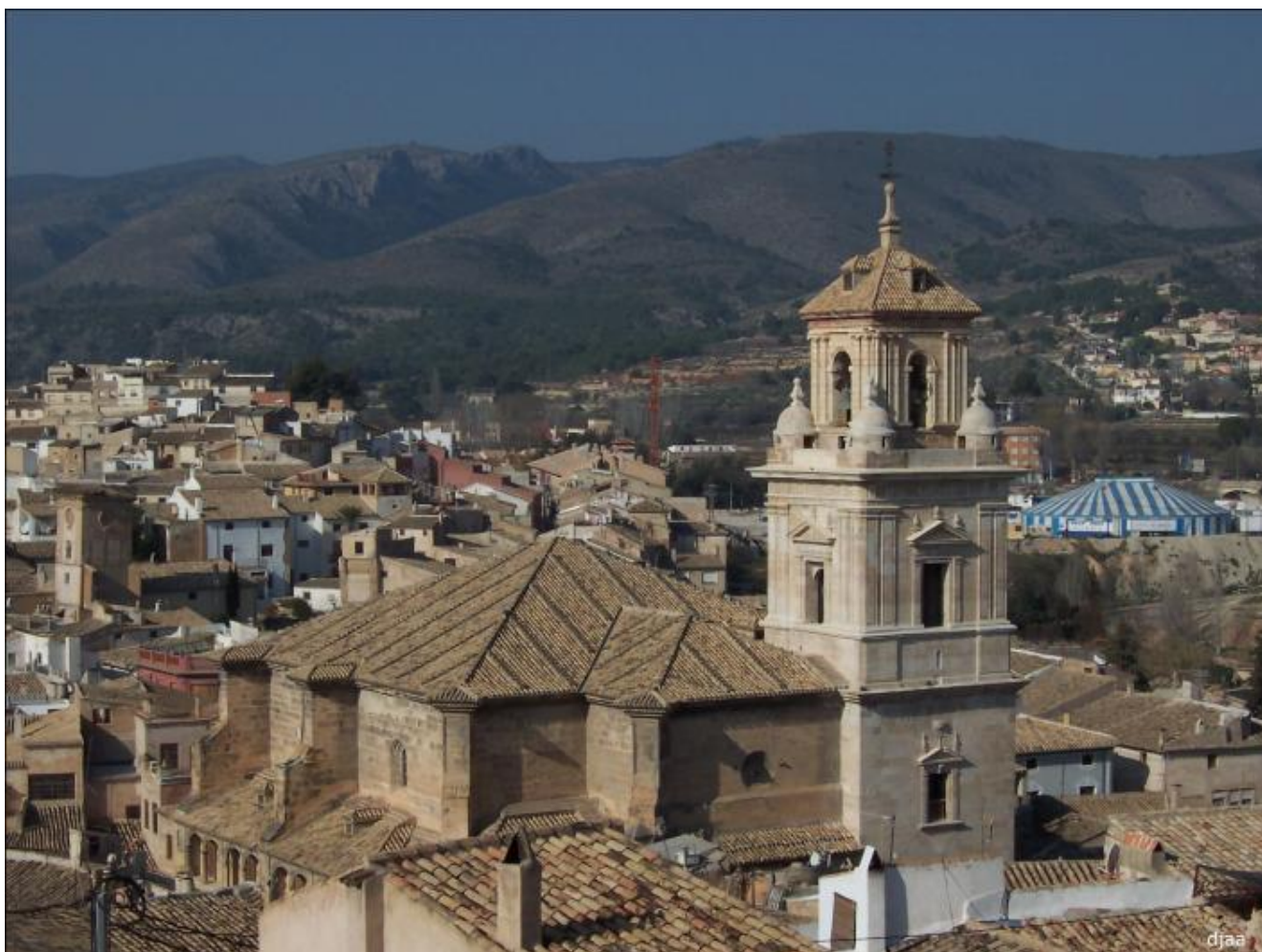
IGLESIA PARROQUIAL DEL SALVADOR

Construido sobre una elevada colina desde la que se domina toda la ciudad. Bajo este cerro, discurre el entramado irregular y desordenado del barrio medieval, en el que hoy día, todavía se pueden contemplar restos de la conservada muralla. En él se distinguen dos partes claramente diferenciadas: la zona amurallada y el Santuario, comenzando a edificarse en 1617 y concluyendo las obras en el siglo XVIII. El recinto amurallado forma un heptágono rodeado de 14 torreones. La iglesia es de traza renacentista con clara influencia herreriana y con una espléndida fachada barroca de mármol rojo y negro de la zona. Desde el interior del Santuario se accede al Museo de la Vera Cruz (antigua Casa del Sacristán) donde se exponen interesantes colecciones de pintura, orfebrería y arte sacro. El Castillo, como conjunto, está declarado Monumento Histórico-Artístico Nacional desde 1944.