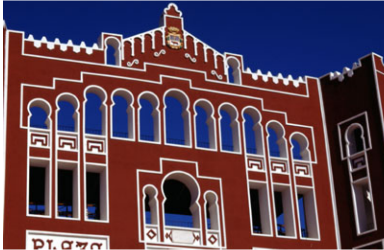
FACHADA PRINCIPAL DE LA PLAZA DE TOROS