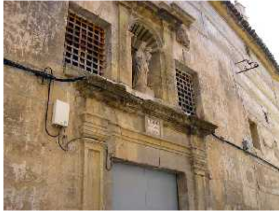
PORTADA MONASTERIO DE SAN JOSÉ, Foto: www.regmurcia.com