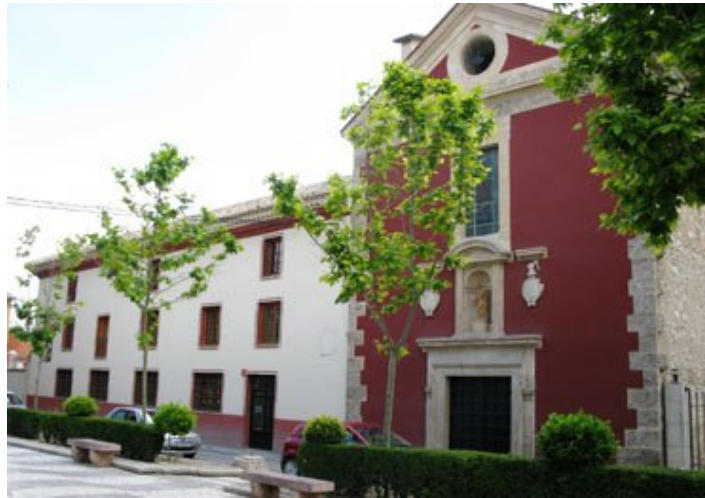
CONVENTO DEL CARMEN, Foto www.murciaturistica.es