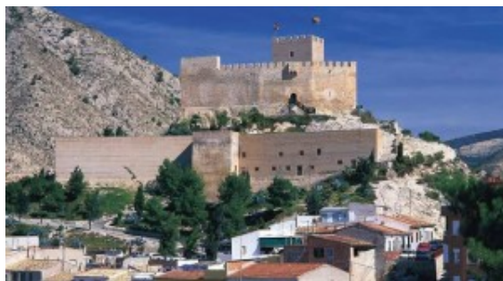
CASTILLO DE PETRER

Este Castillo (siglo XII-XIII) está situado sobre un promontorio llamado Cerro del Testigo de unos 461 metros de altura. Domina su vista sobre las poblaciones de Petrer y Elda, enmarcadas dentro del valle del Vinalopó y pertenecientes a la provincia de Alicante. Castillo fronterizo por el tratado de Almizra (1244), pasa a territorio de Castilla.