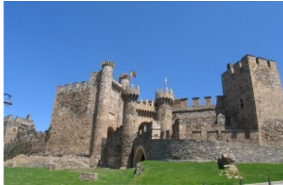
CASTILLO DE PONFERRADA

El Castillo de Ponferrada (siglo XII). Situado en la villa que lleva su mismo nombre y ya inmerso en la tierra de reyes como es la provincia de León.