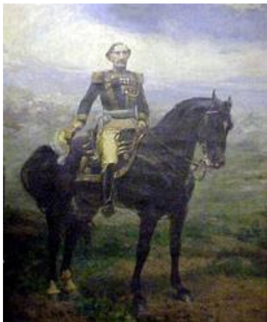
General Bartolomé Mitre

de su época. Se le llama el pintor que filmaba, extraordinaria muestra a la altura de Sorolla, Fortuny y Madrazo.