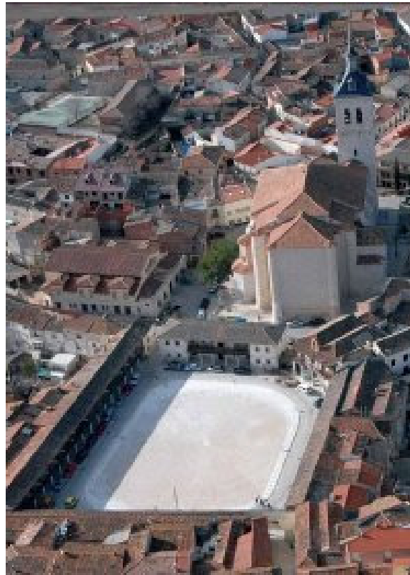
Colmenar de Oreja

Localidad de origen romano y posteriormente árabe, tuvieron lugar varios hechos históricos, su fortaleza de enorme valor estratégico, que fue cristiana y mora, pasando de uno a otros varias veces. La variedad de los pobladores ( colmenaretes ) de sus orígenes, de sus oficios y los amplios y reales derechos a ellos otorgados por el Fuero de Oreja, habian convertido a Colmenar en uno de los pueblos más importantes de Castilla.