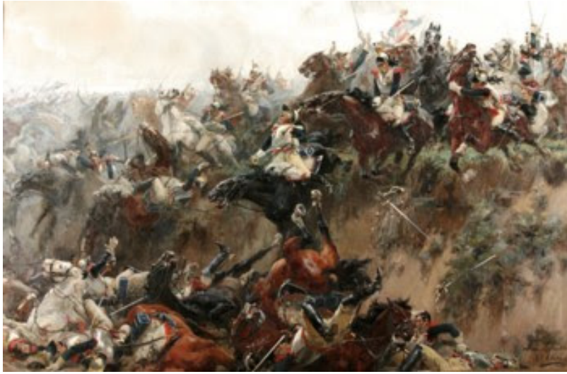
El Barranco de Waterloo