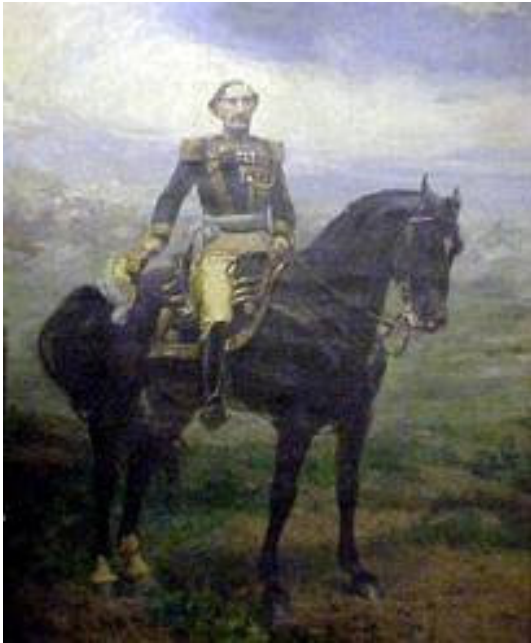
General Bartolomé Mitre

de su época. Se le llama el pintor que filmaba, extraordinaria muestra a la altura de Sorolla, Fortuny y Madrazo.