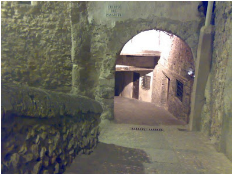
Calles de Cuenca

Soñemos Cuenca con los ojos del licenciado Torralba para romper las barreras del tiempo y del espacio, y sentir como la ciudad crece en la memoria de su ser, de la mano de todos los que aquí llegaron y vivieron en amor a l agua y a la piedra. Cuenca de guerreros y nobles, de artesanos y siervos de la gleba. Cuenca del pueblo que se hace rumor vivo en las calles, novia de los festejos, orante en la Catedral y bulliciosa en el mercado para girar en si misma en un tornado que todo lo recoge, lo arrastra, lo eleva hasta volar, volar