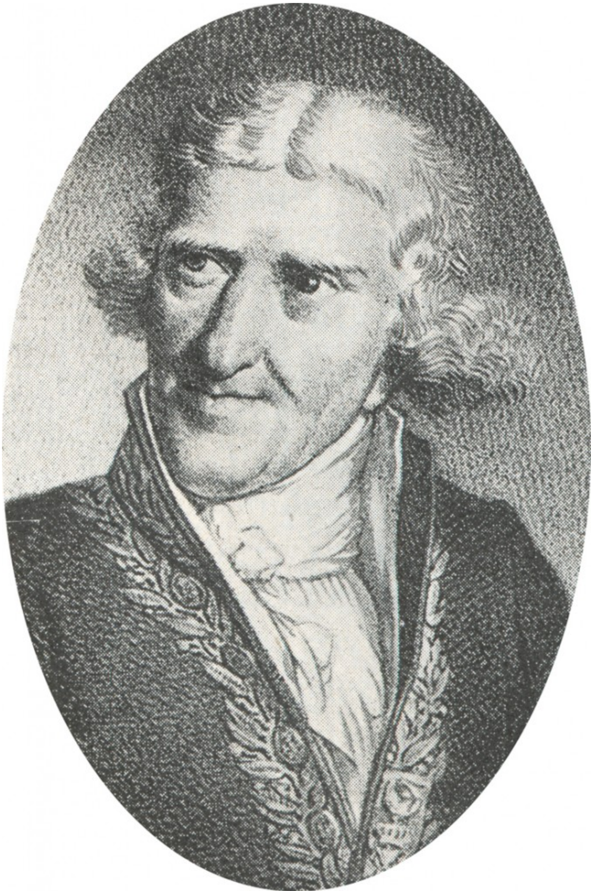
Antoine Parmentier (1737-1813). Su experiencia como cautivo en Prusia durante la Guerra de los Siete Años le llevó a defender la patata como alternativa alimentaria