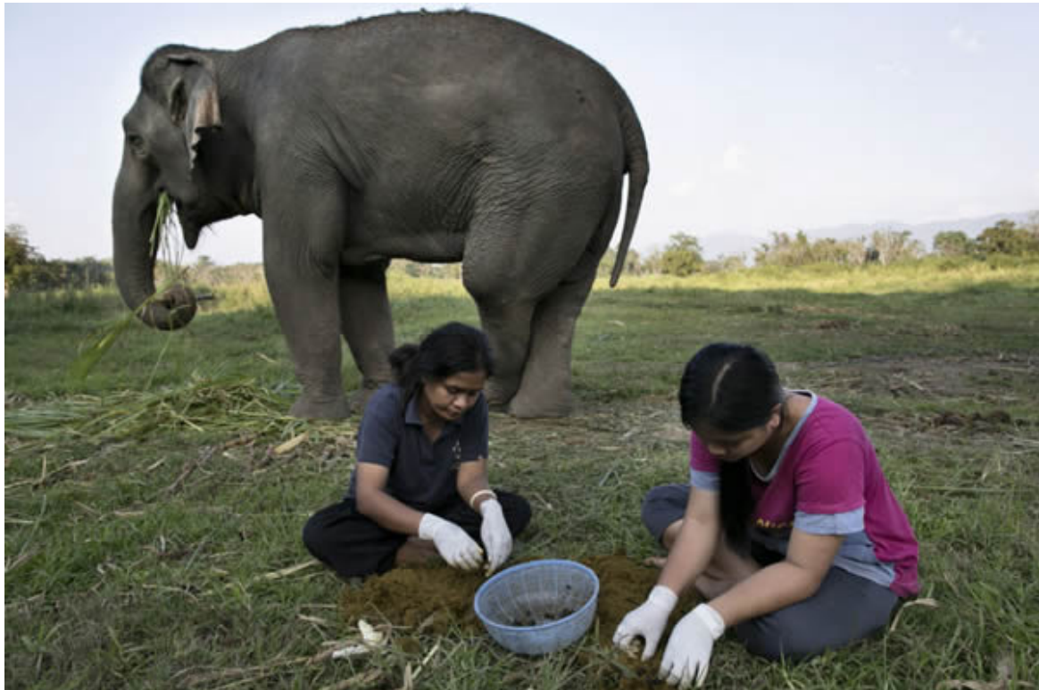
Café Marfil Negro

Calculando el tiempo que tardaría en llegar el tren que transportaba a los asistentes al acto, el chef dio orden de comenzar a freír las patatas que servirían de guarnición al solomillo del menú.