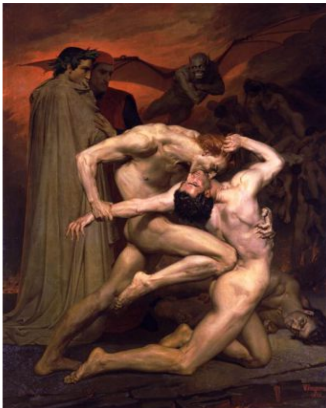
El infierno de Dante

ideas del mal, sitio ideal este, por donde entra el maligno a hacer de las suyas.