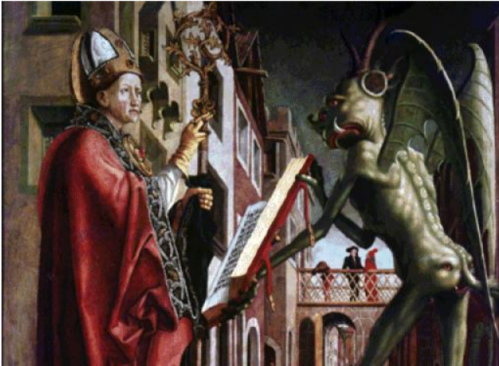
El Diablo sostiene el Misal de San Wolfgang, S XV

Tenemos al temible Satanás “el rey de los príncipes”, que nunca deja de tentar al hombre desde su interior, está celoso de Dios porque él le tiene limitado su poder. Nos rebela contra el bien de Dios y nos hace ser despiadados con lo ajeno y en ocasiones con nosotros mismos, nos hace ser pasotas e inhumanos (Gén 34). Otro de los nombres que tiene Satanás es Belial; igualmente la mención y definición del oponente del Dios Yahveh, puede encontrarse en la Biblia; en la que se mencionan los términos Beelzebú