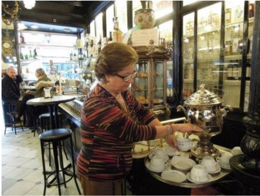
El Caldito del Lhardy

Uno de los camareros perfectamente pulcros y bien avenidos con ese uniforme blanco de antaño nos relató que desde su fundación en 1839 en una casona típica del mundo de Pérez Galdós, en el número 8 de la calle Carrera de San Jerónimo siempre ha existido ese espejo, tan señorial y atrevido en el que los contertulios se peinaban con ademanes elegantes y mantenían vivas sus tertulias para pasar después, a alguno de los seis salones perfectamente decorados a discutir y conspirar los distintos temas filosóficos, políticos y literarios de la época.