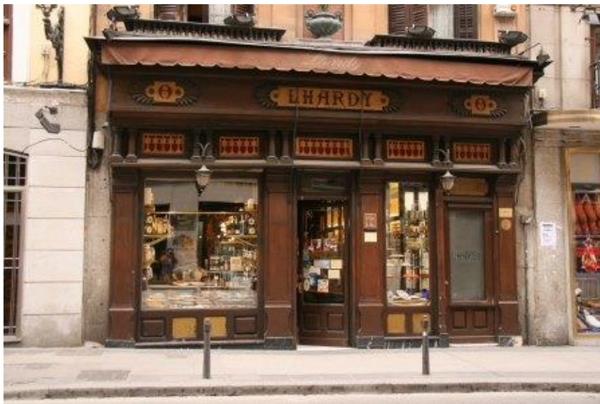
Entrada al restaurante

☒ Entre las tazas humeantes de aquel consomé delicioso y exquisito de Lhardy , después de cocerse a borbotones las suculentas verduras y los trozos frescos de pollo durante horas, las conversaciones suaves en un principio entre aquellos finos tertulianos, pasaron a animarse y a recordar los “ viejos tiempos ” en que Pérez Galdós paseaba por aquellos lugares tan famosos y participaba activamente en los encuentros literarios y filosóficos del momento.