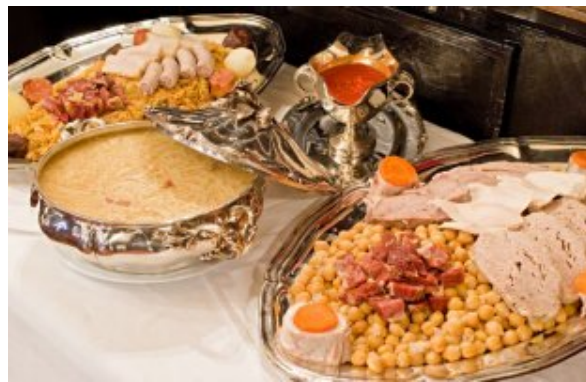
El cocido del Lhardy

local. Si quieren y al final, se deciden pueden pasar al Salón Isabelino, al Salón Blanco o al Salón Japonés. En cualquiera de ellos, si es de menester señor, se lo serviremos a los señores con mucho gusto. Realmente estos salones conservan el papel pintado de la época, las chimeneas y de más, citados en todas o la gran mayoría de las obras de Pérez Galdós, en las de Azorín y en las de Gómez de la Serna.