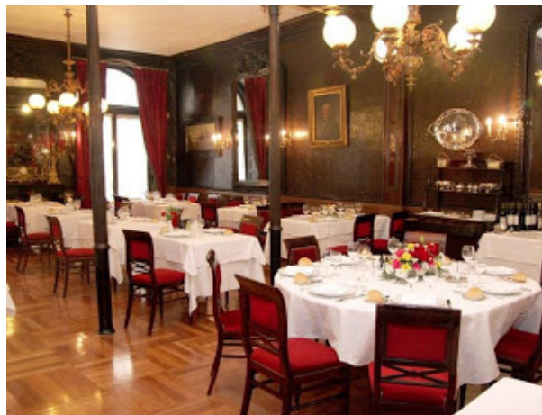
Uno de los salones

– Cuenta la leyenda y, posiblemente fuera verdad – dijo nuestro cómplice y didacta del lugar al tiempo que servía unas cervezas a los clientes – que, Azorín admiraba este lugar. Para él no se podía imaginar uno Madrid en su tiempo sin “ Lhardy ”. Explicaba a su público la grandiosidad del espejo, con esa talla dorada, al fondo de la tienda; expresaba una gran belleza la consola con su tablero de mármol blanco. Azorín – dicen – era un gran admirador del lujo desmedido en muchas ocasiones de este local en los que han pasado personajes muy famosos y emblemáticos del mundo de la literatura, artistas o filósofos.