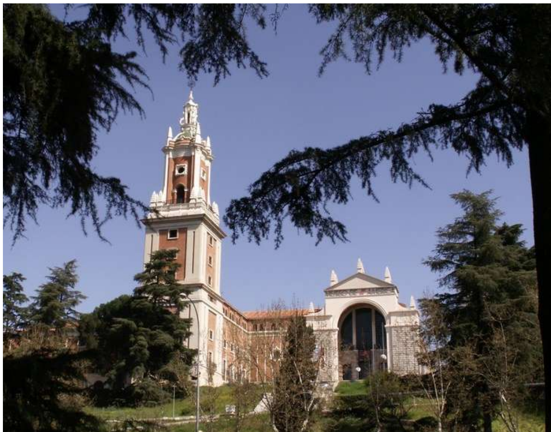
FACHADA MUSEO DE AMÉRICA, MADRID

La ciudad de Madrid cuenta con numerosos atractivos culturales, y no todos están citados en los itinerarios a realizar o incluidos en los paquetes comercializados. Es posible que usted no conozca el Museo de América.