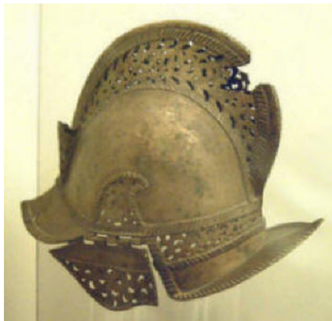
CASCO DE SOLDADO ESPAÑOL

El Museo de América de Madrid es un componente de la red de los museos estatales españoles que reúne amplias colecciones que proceden de las distintas culturas del continente americano, lo que permite no sólo admirar piezas únicas sino también valorar la capacidad del hombre americano para desarrollar diferentes estrategias vitales que se manifiestan en diversos universos simbólicos, cargados muchas veces de un fuerte mestizaje.