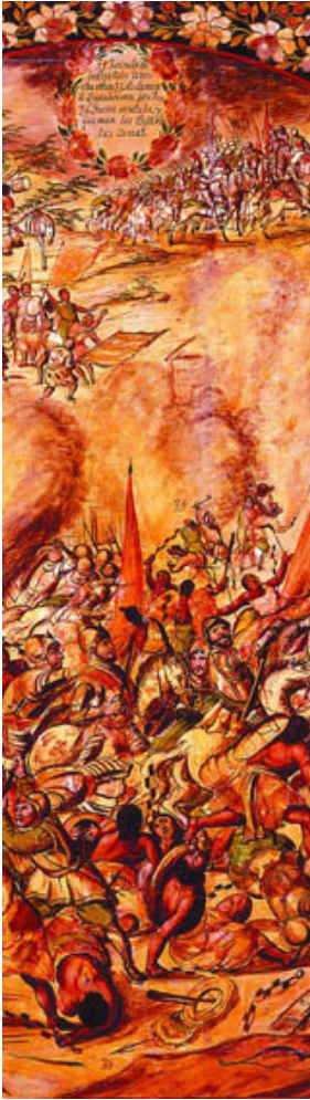
Tabla 'Retirada española o Noche triste'. 1698. Miguel y Juan González. Museo de América. Madrid.

que, con un enfoque antropológico, intentan mostrar la compleja realidad americana.