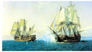
DIVERSOS CUADROS... DIVERSAS BATALLAS NAVALES