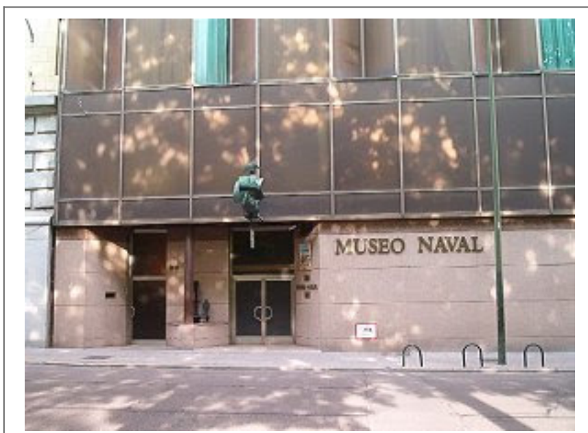
Entrada al Museo Naval

Si Alguien visita Madrid, no debería de pasar por alto la visita al Museo Naval.