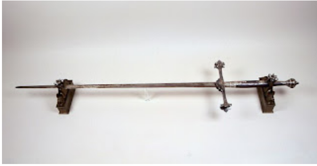
Montante de D. Juan de Austria

En cuanto a las armas blancas, veremos el montante bendito de Juan de Austria que el papa San Pio V le dio antes de la batalla de Lepanto (1571). También están los sables de honor fabricados en Versalles por Nicolás Boutet, armero de Napoleón y que fueron entregados al insigne marino y héroe de Trafalgar D. Cosme Damián Churuca, (1761 – 1805).