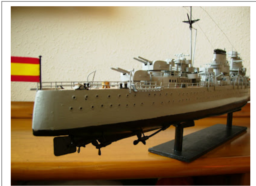
Maqueta del crucero Canarias

infantería de Marina, que abarca desde el siglo XVII hasta el momento actual. La pieza más notable es el Estandarte Real de Capitán General de Galeras del Mediterráneo Don Francisco Gutiérrez de los Ríos, Conde de Fernán Núñez.