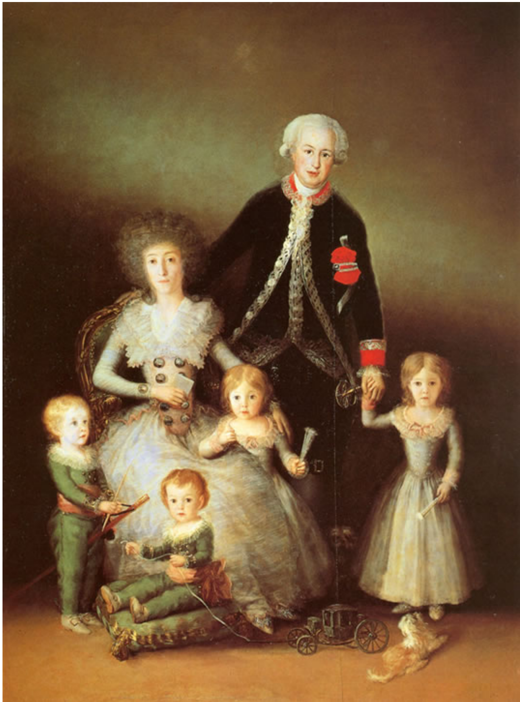
Los Duques de Osuna, óleo de Goya

Casada Doña María Josefa de la Soledad Alonso Pimentel y Téllez-Girón con el IX Duque de Osuna, don Pedro Téllez Girón y Pacheco, el 29 de diciembre de 1771 fue una gran mujer de su tiempo con ciertas