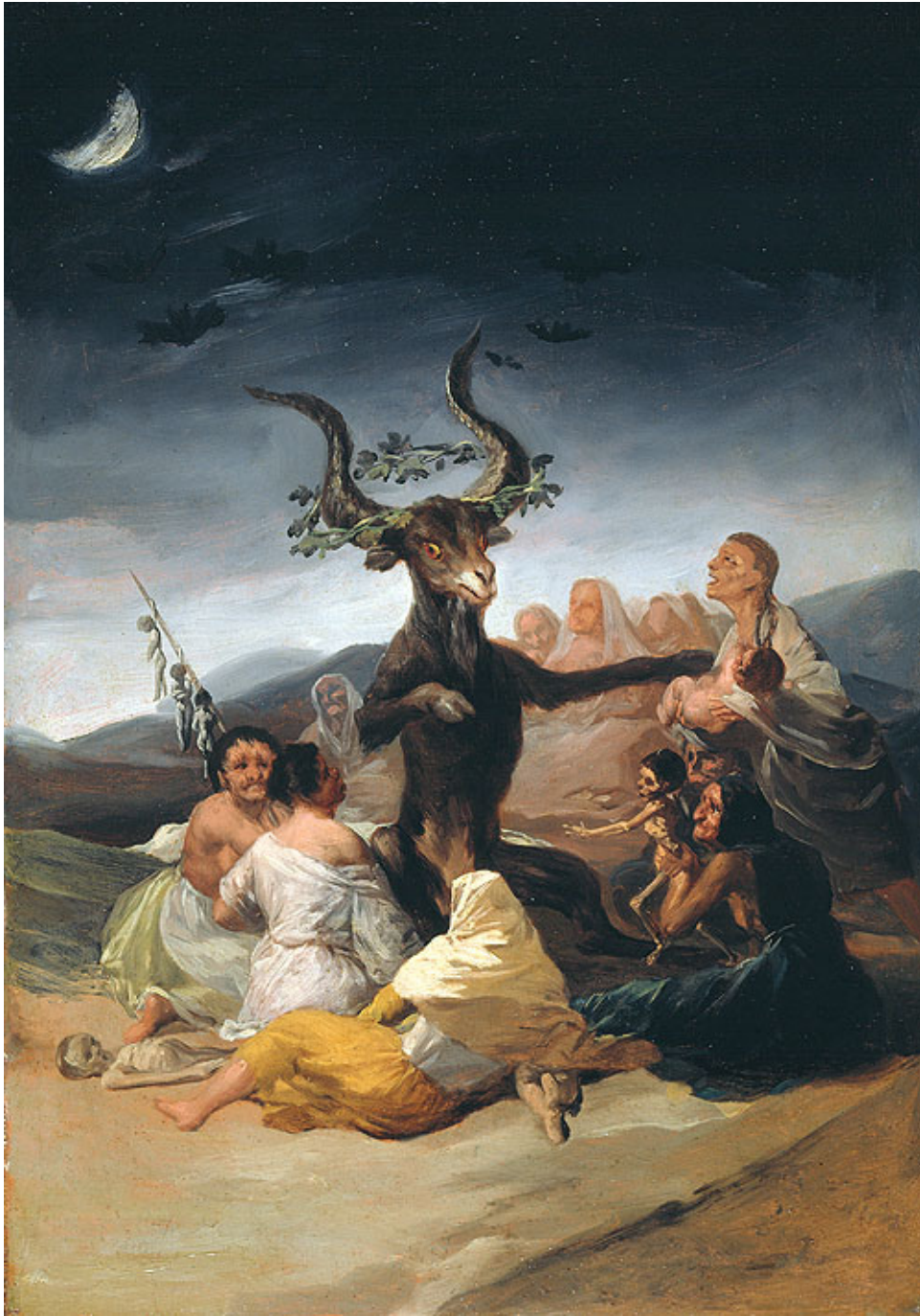
Aquelarre, Óleo de Goya. Museo Lázaro Galdiano- Madrid

Fue mecenas, protectora y la dama que inspiró a músicos, literatos, artistas y pintores; el primero de ellos y más conocido fue Goya con el que siempre