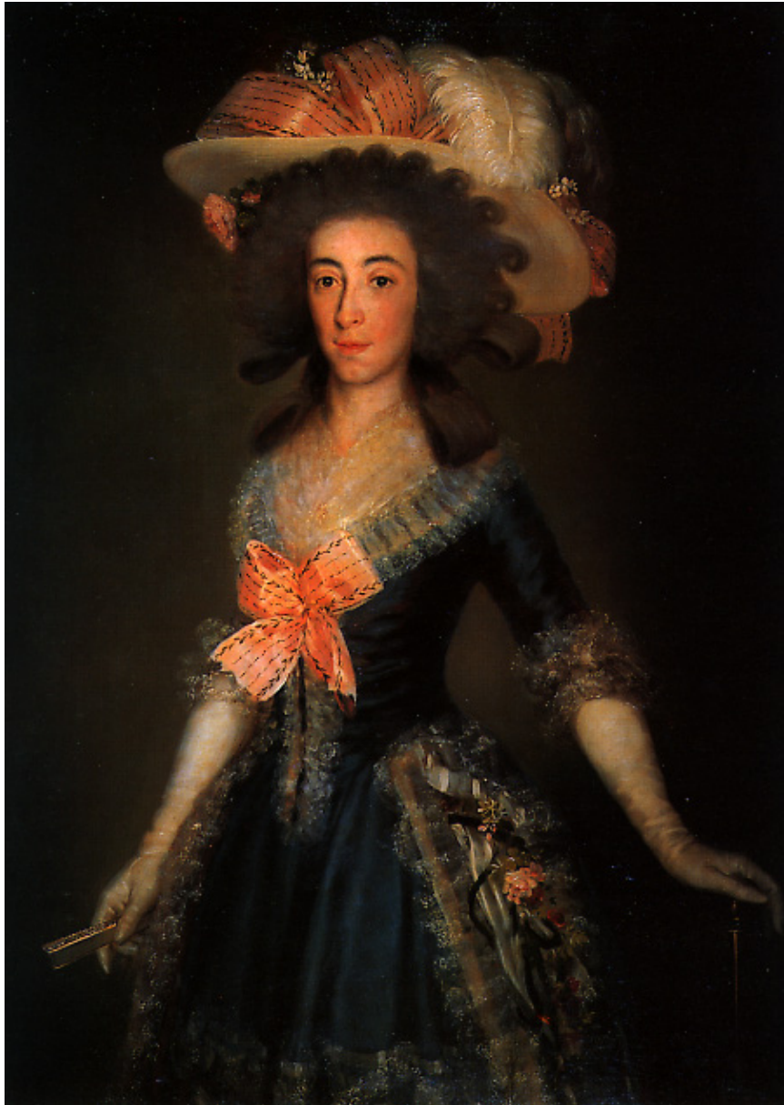
María Josefa de la Soledad, Duquesa de Osuna, o La Condesa Duquesa de Benavente (1785). Óleo sobre lienzo. 111 x 80 cm. Colección B. March (Palma de Mallorca, España).

La Duquesa, María Josefa Alonso Pimentel era una mujer poco común en su tiempo, con gustos deliciosos y exquisitos que llevaba hasta sus últimas consecuencias.