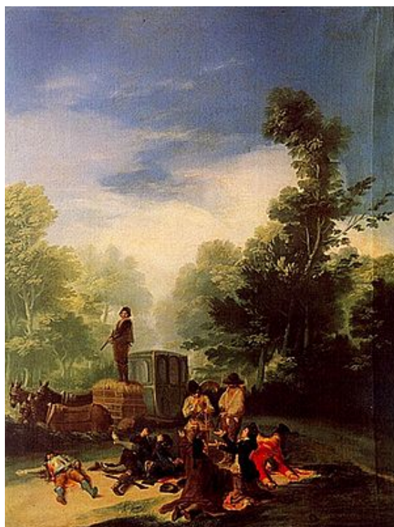
Asalto al Coche. Óleo de Goya

hoy se llama, la iglesia de Santa Catalina de Alejandría y también podría verse a lo lejos, un castillo, tal vez el de La Alameda de Osuna en ruinas.