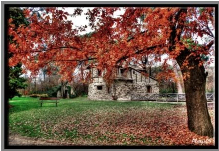
Otoño en El Capricho