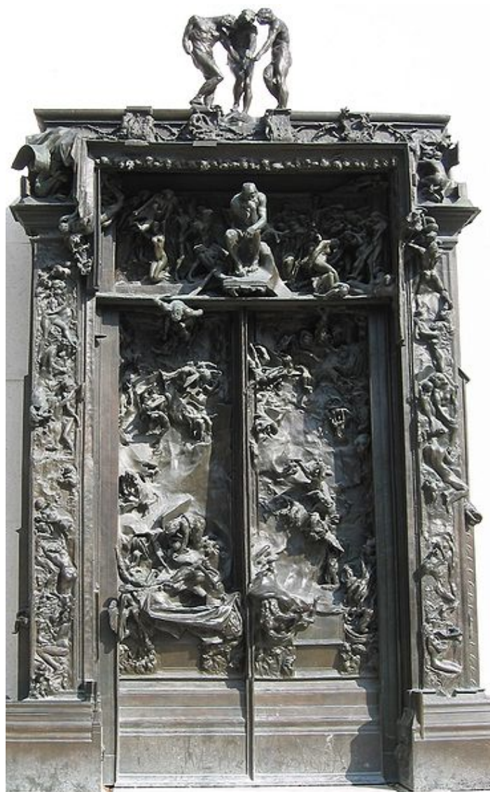
LAS PUERTAS DEL INFIERNO

El período entre 1880 y 1900 fue el más fecundo de su vida. En él realizó bustos, monumentos y grandes composiciones escultóricas dentro de una tendencia impresionista : el grupo en bronce de Los burgueses de Caláis , el monumento a Víctor Hugo, el Balzac Las puertas del Infierno (“de donde salió El Pensador ”) y el Monumento a Sarmient ».