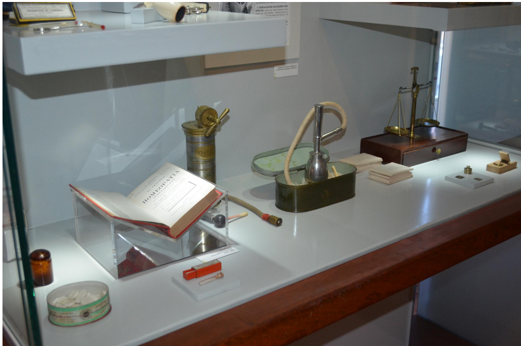
Vitrina Homeopatía Museo-S-P

Ante el susto general de las Siervas de María, que regentaron el Hospital en su primera época, en 1878-1888, les recomendó rezar al Niño y tomar tila. Desde marzo de 1888 las Hijas de la Caridad fueron las encargadas de atender a los pacientes. Acudían a curarse personas con todo tipo de enfermedades y se trataba con homeopatía al que voluntariamente lo aceptase.