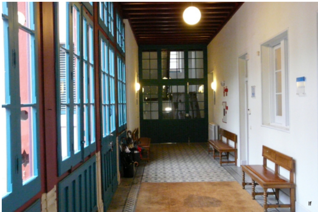
Interior del hospital