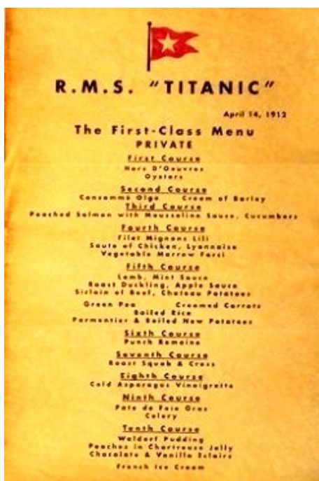
Menú de la cena en primera clase

Escoffier había preparado para el viaje inaugural del Titanic, las que el día 14 de abril figurarían en los menús.