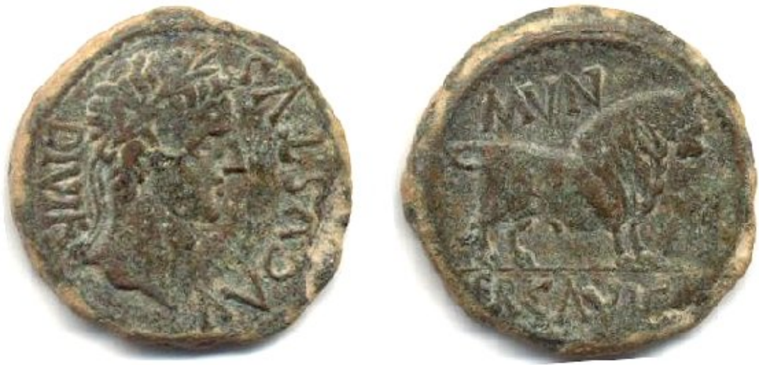
Monedas acuñadas en Ercávica

El topónimo del lugar que ha pervivido a lo largo de los siglos es de Castro de Santaver, y ello no deja lugar a dudas. Nuestra experiencia nos dice que donde hay un topónimo de “castro” hubo un asentamiento anterior a los romanos, indefectiblemente. Lo de Santaver tiene que ver con el mal oído de los humanos para los nombres extranjeros. Las grandes ciudades romanas se convirtieron en sedes de obispados en tiempos de los visigodos, Ercávica fue una de ellas, y al igual que Toledo se asimiló a los carpetanos, Ercávica lo hizo con los celtíberos. Cuando los musulmanes conquistaron España respetaron estas demarcaciones ahora