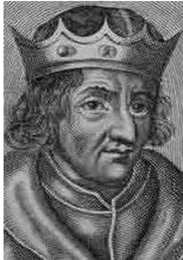
Chilperico II (670- 721), Merovingio, fue rey Franco pero solo de Neustria y rey de los Burgundios