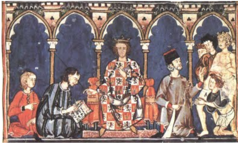
Vasallaje, estampa del libro de juegoslfonxand

Palestina y Grecia. Desde Alemania se propagó a tierra eslava. En los siglos X-XI pasó a Centroeuropa.