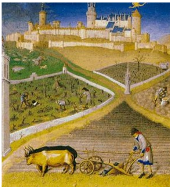
La economía feudal

poblado existía un tribunal de justicia de primera instancia, formado por los oficiales aldeanos. Entre los siglos XI al XIII, obtuvieron cartas de libertades, que establecían los derechos y deberes de señores y campesinos.