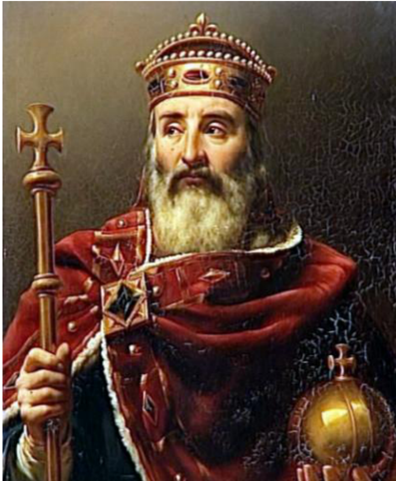
El Emperador Carlomagno, también llamado Carlos I el Grande (742-814)

El vasallaje alcanzó su cénit con Carlomagno. Sus causas fueron: 1- la política real de vasallaje para consolidar la corona; 2- la ambición aristocrática de poseer súbditos propios; 3- las guerras e incursiones de vikingos, árabes, eslavos y magiares. El vasallo real (“ vassi dominici ”) era el más distinguido. Obtenía del rey tierras ubicadas en puntos estratégicos del