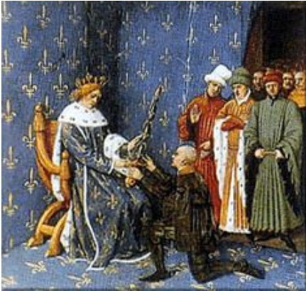
Vasallaje a su señor

Santiago ", en León empieza a utilizarse el vocablo " vasallo ". Sustituirá al ancestral " milites " (" caballero "), en el s. XII. El acto de vasallaje era el besamanos al señor.