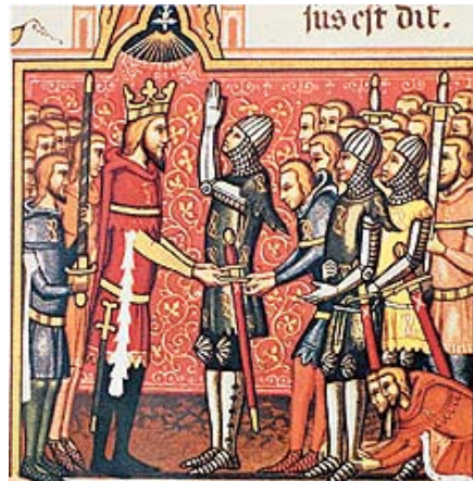
Roldán con su tío Carlomagno