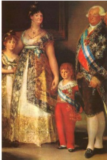
LA FAMILIA REAL DE CARLOS IV, Cuadro pintado por Goya, Museo del Prado Madrid

Ante esta situación, el ayuntamiento de Bogotá acudió al rey de España, Carlos IV, quien el 25 de diciembre de 1802 consultó la opinión del Consejo de Indias sobre la actitud del virrey y preguntó acerca de la posibilidad de enviar una expedición para difundir la vacuna por América.