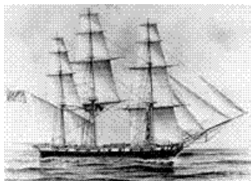
CORBETA MARIA PITA

Una vez formada toda la tripulación de la corbeta además del personal de la expedición, esta salió del puerto de la Coruña el 30 de noviembre de 1803.