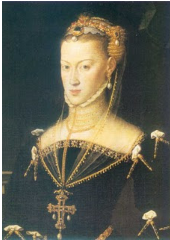
Emperatriz María de Austria-Oleo de Antonio Moro (Museo del Prado-Madrid)