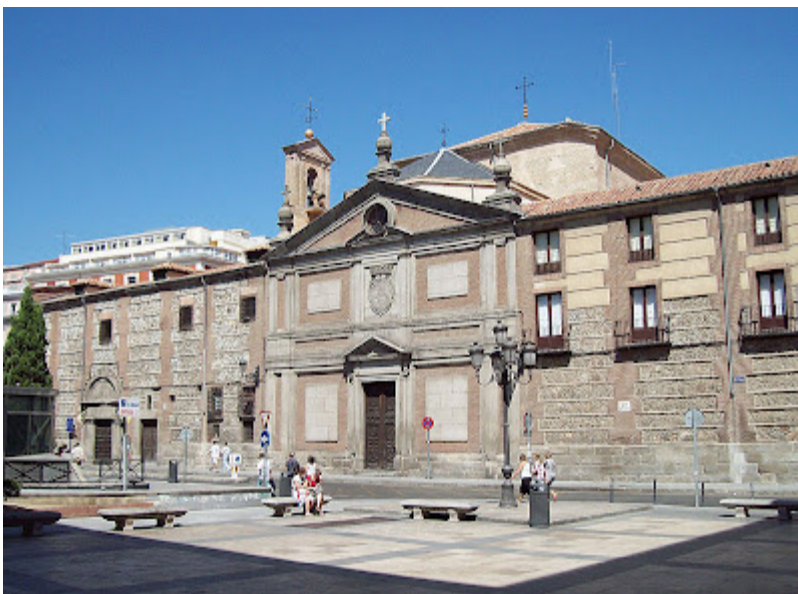
Monasterio de las Descalzas Reales, Madrid

Su primer gran lector, como de casi toda la literatura clásica española, fue Marcelino Menéndez y Pelayo, que nos ha dejado la valoración paradigmática de nuestro autor: “Fray Juan de los Ángeles es uno de los más suaves y regalados prosistas castellanos, cuya oración es río de leche y miel... No es posible leerlo sin amarle y sin dejarse arrastrar por su maravillosa dulzura, tan evangélica como su nombre”. Resalta el ilustre estudioso que en los libros de Fray Juan asombra la verdad y profundidad en el análisis de los afectos, libros que deleitan y regalan por igual al contemplativo, al moralista y al literato. En ellos se aprecia a un gran psicólogo y un consumado maestro de espiritualidad.