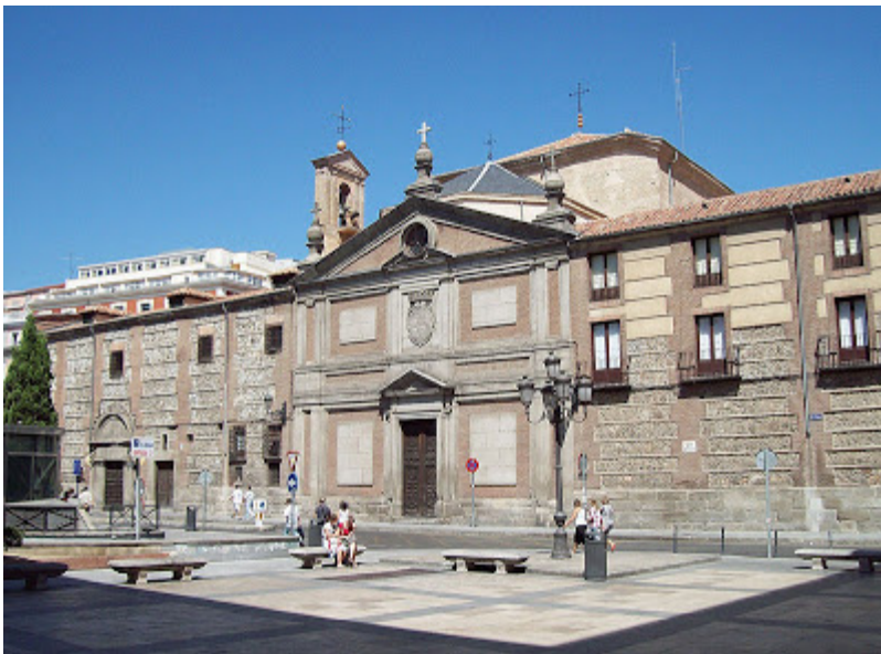
Monasterio de las Descalzas Reales, Madrid

Su primer gran lector, como de casi toda la literatura clásica española, fue Marcelino Menéndez y Pelayo, que nos ha dejado la valoración paradigmática de nuestro autor: “Fray Juan de los Ángeles es uno de los más suaves y regalados prosistas castellanos, cuya oración es río de leche y miel... No es posible leerlo sin amarle y sin dejarse arrastrar por su maravillosa dulzura, tan evangélica como su nombre”. Resalta el ilustre estudioso que en los libros de Fray Juan asombra la verdad y profundidad en el análisis de los afectos, libros que deleitan y regalan por igual al contemplativo, al moralista y al literato. En ellos se aprecia a un gran psicólogo y un consumado maestro de espiritualidad.