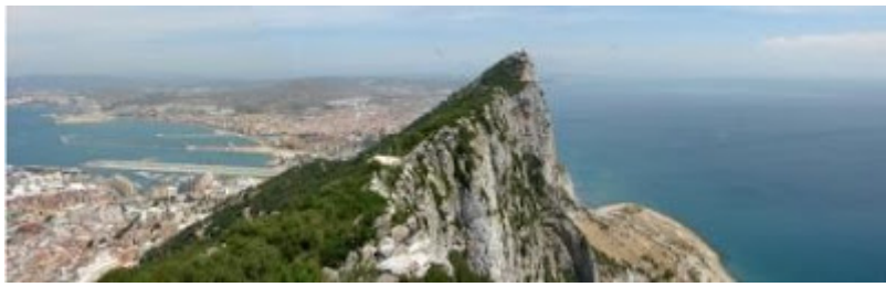
Cima del Peñón

acondicionada para un espectáculo de luz y sonido, constituyen un especial atractivo.