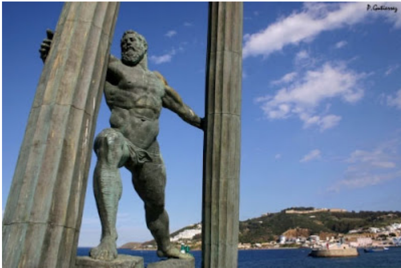
Monumento a Hércules en el puerto de Ceuta

La narración que hace la mitología de los doce trabajos encargados al semidiós Hércules y consecuentemente de las proezas llevadas a cabo por éste para alcanzar el triunfo en cada uno de ellos, describe los portentos realizados por el héroe mitológico, hijo de Zeus dios del cielo y de Alcmena, mujer mortal casada con Anfitrión. Los encantos de ésta habían seducido al dios quien, vencido por la tentación y mediante una estratagema, consiguió yacer con ella germinando su vientre, con evidente disgusto de Hera, la reina del Olimpo.