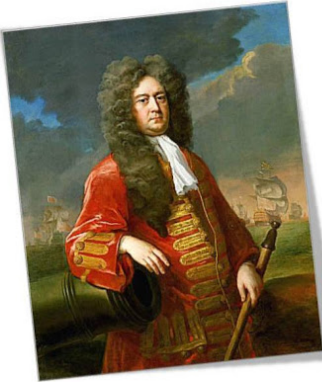
Almirante George Rooke

No había más remedio que buscar la respuesta, especialmente durante los primeros años de su pérdida, a manos del almirante inglés Rooke el 4 de agosto de 1704, y tras la Guerra de Sucesión y la firma del Tratado de Utrecht en 1713, en la incompetencia y corrupción de los respectivos gobiernos de la ineficaz monarquía, más preocupada por asegurar la permanencia de su Casa Real en el trono de España, que en erradicar los espurios y bastardos intereses personales de los sucesivos e ineptos validos reales, entregados a amoríos prohibidos u homosexuales, intrigas palaciegas y ansias de poder y, como consecuencia sujetos a sobornos y chantajes de todo tipo. Los nombres de favoritos reales, desde Patiño, Alberoni, Floridablanca, Aranda, hasta Godoy, irán sembrando de dudas y desconfianza sobre la valía como políticos y hasta sobre posible traición el relato de nuestra historia, encarnados en dichos