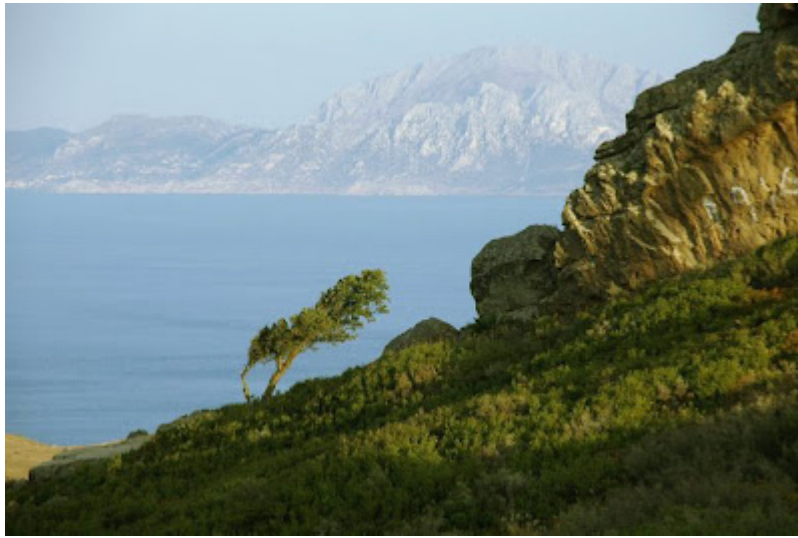
Puerto del Cabrito en la Sierra de Bujedo, (Cádiz)

Una vez coronado el Puerto del Cabrito en la Sierra del Bujedo , como ocurriría a cualquier otro viajero cada vez que hiciera ese camino, quedé inevitablemente sorprendido ante la impresionante majestuosidad del escarpado Calpe, el peñón de Gibraltar enfrentado al Yebel Musa , en las estribaciones septentrionales de la cadena africana del Atlas, y separados entre sí por una bella lengua de agua que, en días claros, exhibe y presume de un increíble azul: el Estrecho que se adorna con el mismo nombre que el peñón.