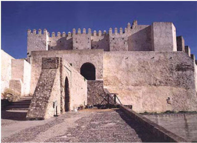
Castillo de Guzmán el Bueno

Después, las distintas circunstancias de mi carrera profesional me mantuvieron alejado de esos lares tan queridos por un largo tiempo. Cuando, una vez vuelto de las ardientes tierras africanas,