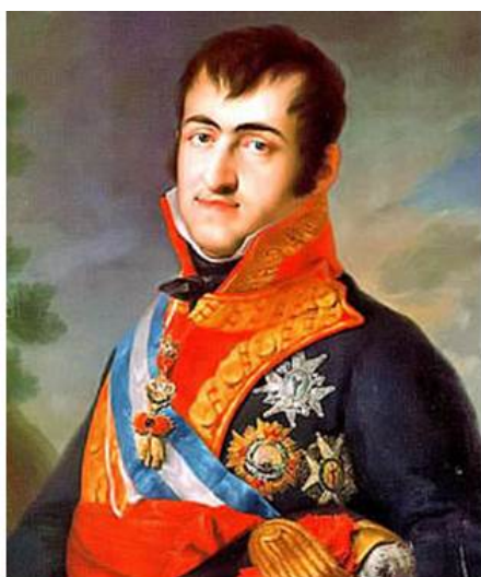
Fernando VII de España