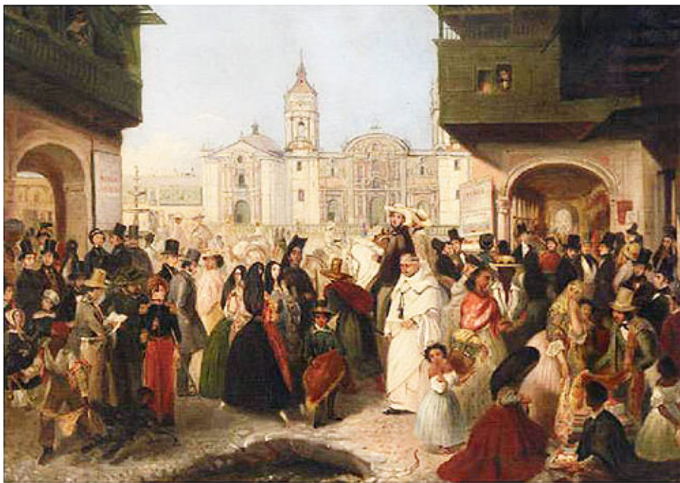
Reuniones en la calle

hispanoamericano , se refiere estrictamente a lo perteneciente o relativo a la América española y no incluye, por tanto, lo perteneciente o relativo a España: «Un completo catálogo onomástico de autores españoles e hispanoamericanos» (Abc [Esp.] 9.5.97).