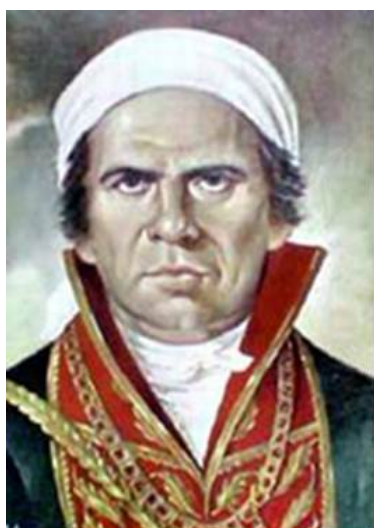
José M a Morelos