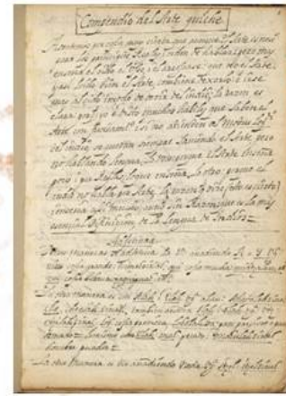
Compendio del arte Maya-Quiche