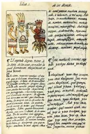
Códice Florentino Náhuatl-español