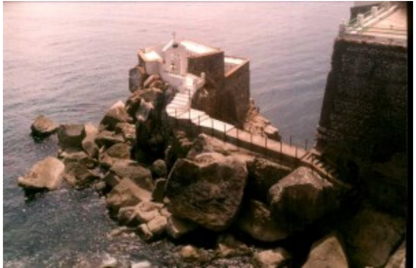
Islote La Pulpera

En Alhucemas el líder marroquí “Abd el Krim” aprendió a leer y escribir, siendo el emplazamiento clave en el desembarco más famoso de la guerra del Rif.