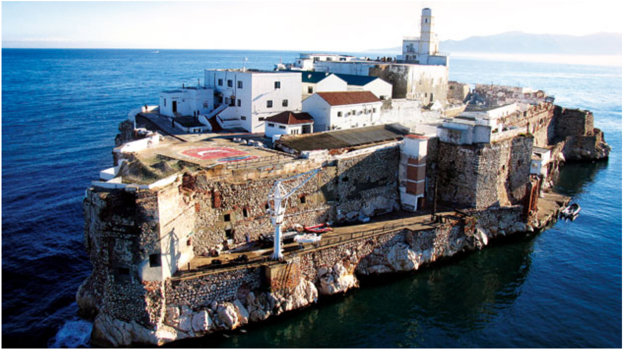
Muelle de alhucemas

Este lugar nunca se integró en el que, desde 1912, fuera el Protectorado Español de Marruecos. Por ello, cuando en 1956 se constituyó el Reino Independiente de Marruecos, este territorio permaneció, al igual que los últimos cuatro siglos, como plaza de soberanía española dependiente de las de Ceuta y Melilla, separada por el mar de Alborán de las costas peninsulares.