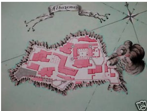
Peñón de alhucemas , plano siglo XVIII

viejas baterías, además de algunos edificios de diferentes épocas, un pequeño muelle, un iglesia y unos almacenes, hay que sumar un viejo y vigilante cementerio situado sobre un diminuto islote llamado "La Pulpera" unido al islote principal por un puente y acceder al lugar donde se encuentran enterrados unos 60 españoles entre civiles y militares. Hay un aljibe que se llena periódicamente con agua traída de la península española y a través de una pequeña desalinizadora que tiene el peñón. Alhucemas, es un punto de amarre de cables submarinos unidos a Melilla, Ceuta y las Península Ibérica. El islote está circunvalado por una calle que adquiere diferentes nombres -del Carmen, Taquillas, Pulpera...- y en donde se