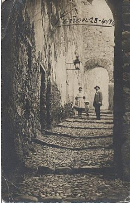
Calle de Don Miguel

Alhucemas es un lugar donde el reloj se ha detenido, es, en todo caso, un lugar nada remoto desde el punto de vista geográfico, pero sí inaccesible por su actual función estratégica y constituye una prolongación natural del territorio español nada menos que desde el siglo XVII.