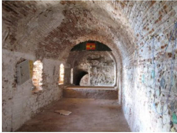
Calabozos del presidio