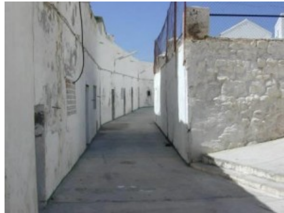
Calles de Alhucemas

Alhucemas, fue ocupado definitivamente en tiempos de Carlos II, el 28 de agosto de 1673, por una flota comandada por el príncipe de Montesacro, Andrés Dávalos, a su vez General de Armada y que la rebautizó con el nombre de “San Agustín y San Carlos de Alhucemas” en honor los barcos que lo llevaron a esta tierra con el fin de combatir a las constantes incursiones de los corsarios otomanos.