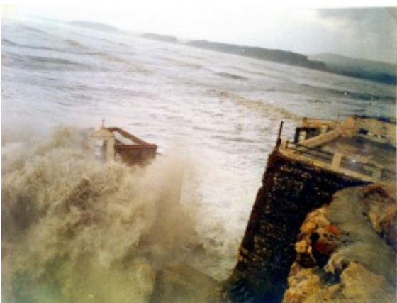
Alhucemas en la tormenta

conservan las antiguas viviendas de la población civil, así como muchas otras dependencias fuera de uso, en parte excavadas en la misma roca, que debieron ser los temibles calabozos de un antiguo presidio de políticos y desterrados, donde en 1838, metidos el siglo de la ilustración, los condenados se sublevaron. Pero el lugar más importante es el callejón de El Fuelle, que une dos tramos de la calle circular y desde el que se veía el orificio por donde respiraba la isla y salía el aire comprimido por la acción de las olas sobre el cascabel. Se trata de un enorme peñasco suelto que el aire provocado por los temporales levanta y al golpear los cimientos de la isla la hace trepidar.