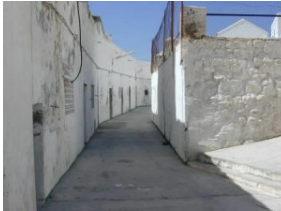
Calles de Alhucemas