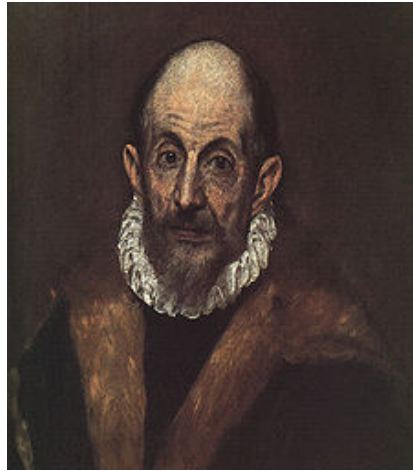
Autorretrato de El Greco de viejo. Museo Metropolitano del Arte. New York

A nuestro gran maestro, El Greco, le convierten en el representante por excelencia de una escuela nacional, identificando en sus obras el alma de España, apreciando a su vez la personalísima síntesis de una formación greco-bizantina con las decisivas estancias en Roma y Venecia.