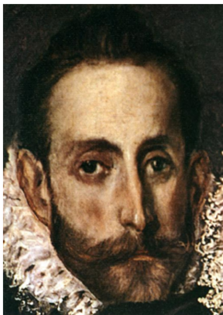
Autoretrato de El Greco

Vitruvio” con anotaciones y comentarios es posible reconstruir su pensamiento artístico. Muere el 17 de abril de 1614 aceptándole su nacionalización española debido al largo período de tiempo que permaneció en Toledo y al hecho de pertenecer a la escuela además de la veneciana. Considerado el artista más destacado del misticismo español y espíritu castellano, que unió el oriente con el occidente gracias a su nacimiento y a la formación griega.