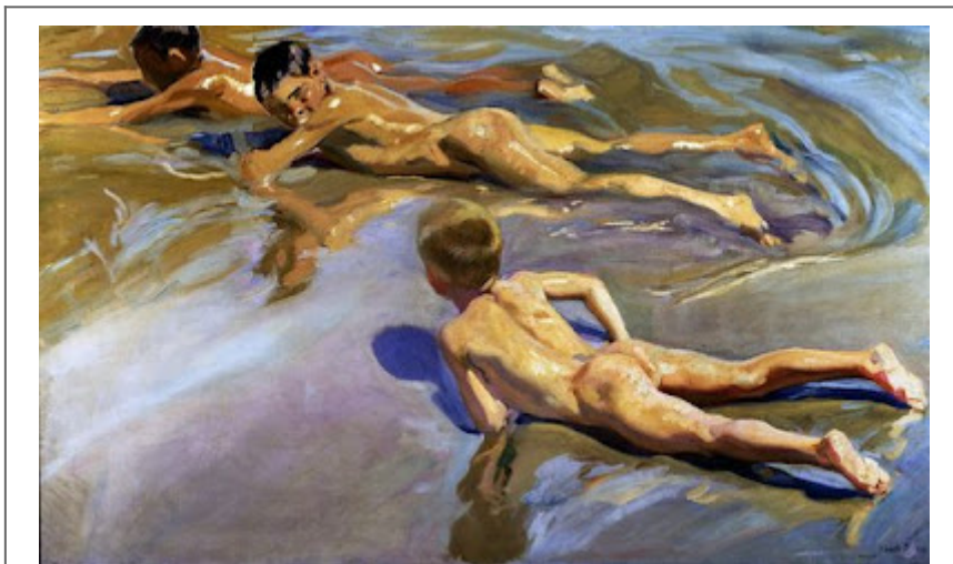
Niños en la playa

Su popularidad se extendió por toda Europa, realizando exposiciones en París, Berlín, Colonia, Londres y finalmente en varias ciudades de Estados Unidos.