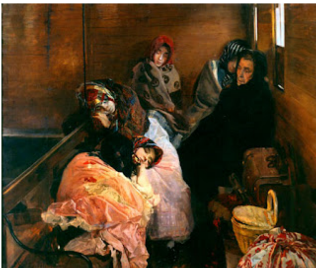
Trata de Blancas

Entre sus temas preferidos hay que destacar su dedicación al paisaje levantino. Realiza continuas escapadas a Valencia, a Javea, para pintar escenas del mar relacionadas con la pesca y la vida de la playa, el baño, los juegos en la arena y los niños. Siempre hallamos la presencia humana. El gran protagonista es la luz, que hace vibrar los colores y marca el movimiento de las figuras. Fue un gran admirador de Velázquez, Ribera y El Greco.