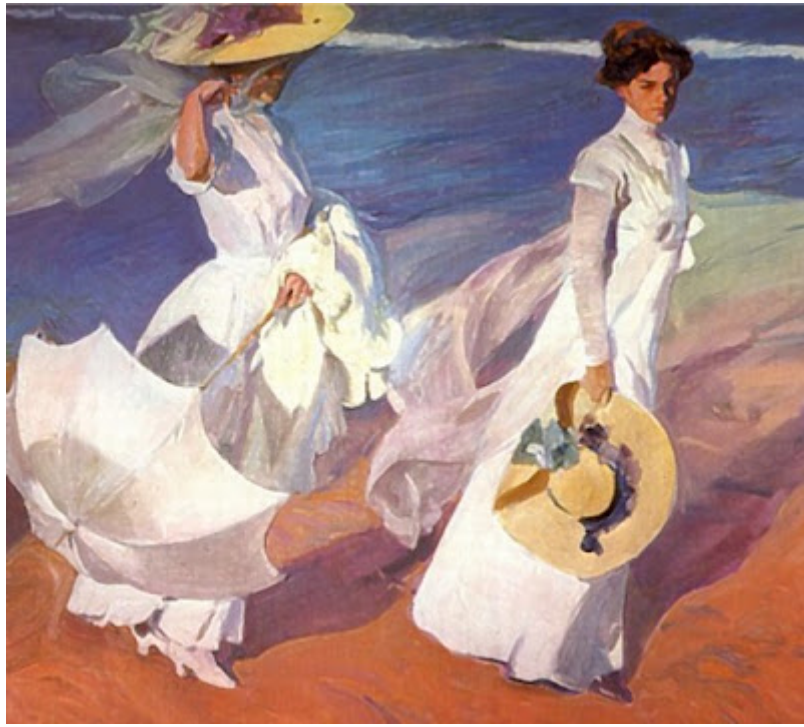
Paseo a orillas del mar

Entre sus temas preferidos hay que destacar su dedicación al paisaje levantino. Realiza continuas escapadas a Valencia, a Javea, para pintar escenas del mar relacionadas con la pesca y la vida de la playa, el baño, los juegos en la arena y los niños. Siempre hallamos la presencia humana. El gran protagonista es la luz, que hace vibrar los colores y marca el movimiento de las figuras. Fue un gran admirador de Velázquez, Ribera y El Greco.