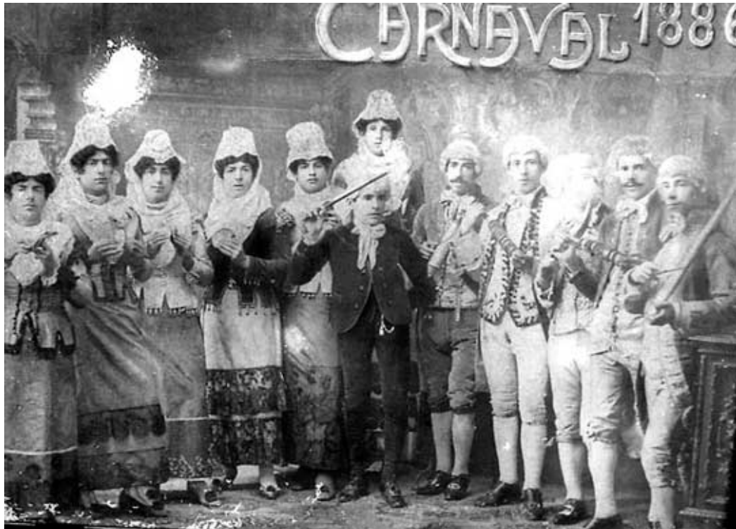
Comprsa las Manolas

Durante la dictadura del general Franco entre 1939 y 1975, los carnavales fueron prohibidos por su carácter festivo y poco religiosos, pero el pueblo de Cádiz una vez más desoyó las indicaciones oficiales, saliendo a la calle disfrazados aún a riesgo de acabar en el calabozo. En esos años la fiesta se trasladaba a los “baches” pequeños bares y tascas donde la gente se reunía para cantar y disfrazarse a escondidas de las autoridades. En estos años fue el propio carnaval el que se disfrazó pasándose a llamar “Fiestas típicas gaditanas”. Para