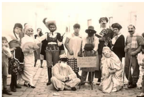
Los años 60

desvincularlas del carnaval, el régimen dictaminó que se trasladasen en el calendario a mayo, con la excusa del clima lluvioso de febrero. En esos años sólo en la localidad de Trebujena, al norte de la provincia de Cádiz se mantuvo el carnaval en el mes de febrero, lo que recuerdan con orgullo los trebujeneros.