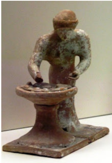
Mujer amasando, museo de Atenas

Los primeros cocineros griegos, fabricaban una galleta de pasta sin levadura y el pan tal como lo conocemos hoy. En el mercado de Atenas podían encontrarse, en la época clásica, además del pan de centeno, el de salvado egipcio, el de trigo negro o sarraceno, el de avena, y todas las variedades del de trigo: cocido, de molde, al rescoldo entre dos planchas de hierro, frito, amasado con leche y aliñado con varias especias. Se encontraban también los de formas caprichosas, como a modo de croissant. Pasar de panadero a confitero es un avance natural, por lo que fueron famosos en la antigüedad sus pasteles que endulzaban con miel.