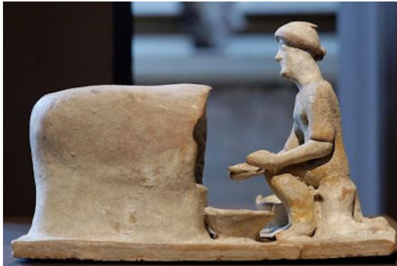
Panadera sacando pan del horno

cocina de evaporación. En el anonimato ha quedado el cocinero que inició la moda de las recetas deconstruidas un día que se le cayó una bandeja al suelo y no tuvo tiempo de arreglar el desaguisado.