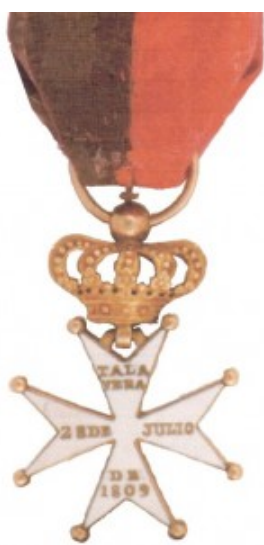
Medalla conmemorativa de la Batalla de

matar si podían. Ante esta proliferación de la guerrilla, el mariscal Víctor dictó un bando (13 de abril de ese año 1809) en que se decía que ante la muerte de un francés serían apresados indiscriminadamente cuatro habitantes del pueblo, los cuales serían ejecutados si no aparecía el culpable en cuarenta y ocho horas; y en caso de reincidencia, la villa, ciudad o aldea sería entregada al saqueo y los habitantes pasados a cuchillo: además, nadie podía circular por los caminos sin un pasaporte expedido por las autoridades francesas y todo aquel que fuese encontrado con armas sería ahorcado en el término de veinticuatro horas.