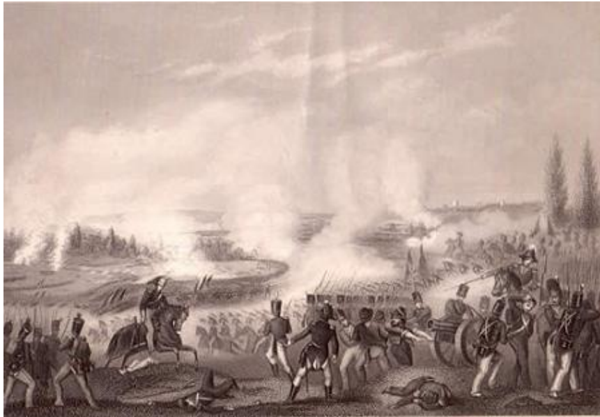
Batalla de Talavera

Conocemos la razón y el origen de aquella cruenta guerra. Napoleón, que se había erigido en Francia con todos los poderes, soñaba con una Europa, cuyas monarquías estuviesen bajo su dominio, para lo que se autoproclamó emperador . Aprovechó la debilidad de la monarquía española y, con la excusa de ocupar Portugal, ocupó España en marzo y abril con una