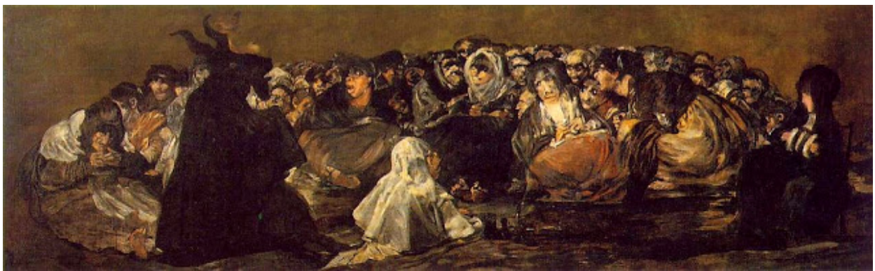
El Aquelarre. Goya

En relación a magos señalaba el que fuera canónigo de Cuenca que “esta palabra es pérsica, y vale tanto como sabio, o filósofo” , aclarando que a esta razón se debía que dicho término fuera el empleado para aludir a los tres hombres que adoraron al Niño si bien, a diferencia de los magos del Faraón y de “todos los que usan el arte mágica condenada, y reprobada” , ellos no eran “encantadores” .