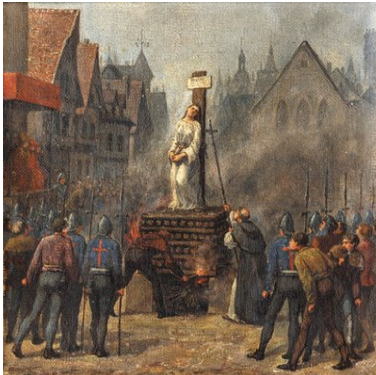
Quema de brujas por la Inquisición.