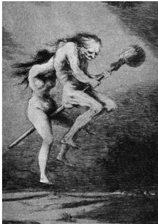
El vuelo de la Bruja. Goya

En las décadas de la Contrarreforma, el Santo Oficio de la Inquisición, puesto en marcha en Castilla por Isabel y Fernando en 1478, vigilaba