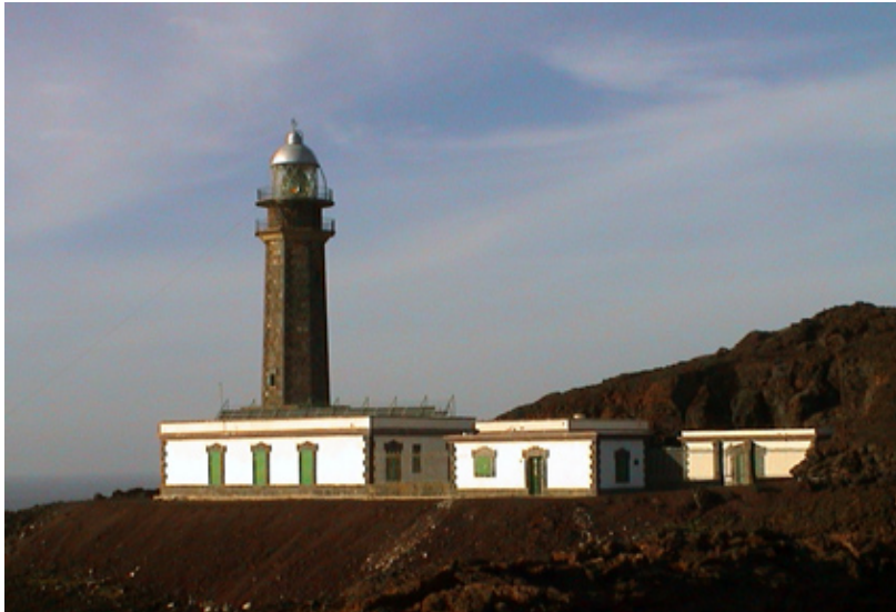
FARO DE ORCHILLA

Hoy día podemos visitar en lo que debió seguir siendo el meridiano 0^{\circ} , el Faro de Orchilla , construido por ser un enclave estratégico para la navegación y en funcionamiento desde 1933.