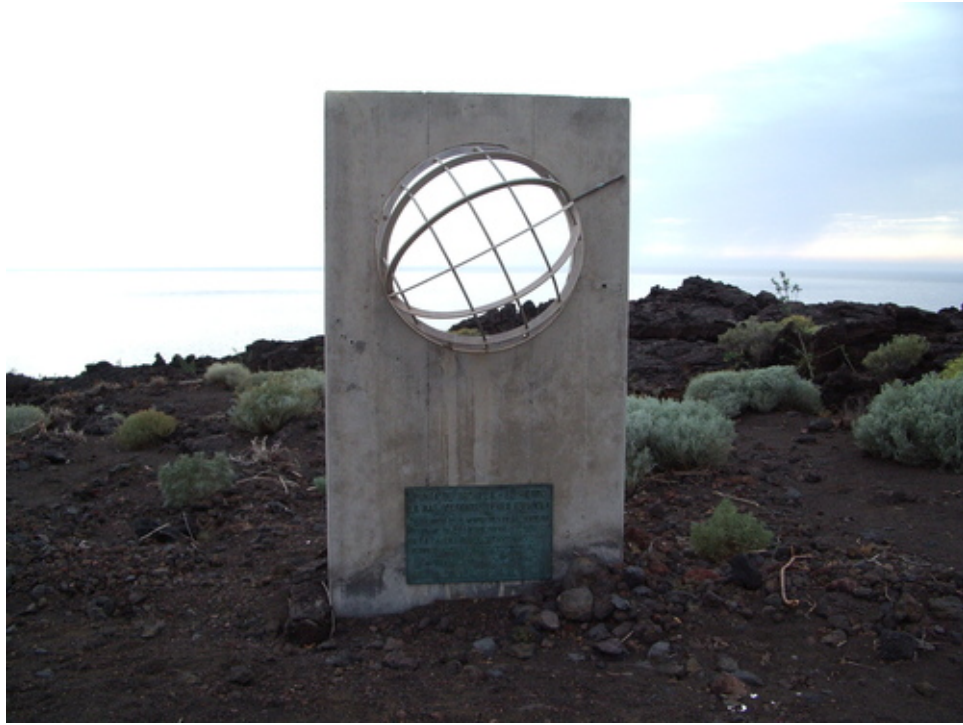
MONUMENTO AL MERIDIANO

La más occidental y meridional , emplazada en el sudoeste, a 27'7 grados norte y 18'0 grados oeste, hasta el descubrimiento de América en 1.492 se consideraba el límite del mundo conocido. Desde el siglo II se aceptó que, la línea que une los dos polos o Meridiano 0º, pasaba por Punta Orchilla (punto más Occidental de España), y así aparece en los primeros mapas de las tierras exploradas, realizados según los criterios cartográficos aportados por Marino de Tiro y Claudio Tolomeo (Escuela Alejandrina y Tolomeo) en su obra «Geografía», “cuando el mundo era plano y era sostenido por cuatro ángeles en sus esquinas” .