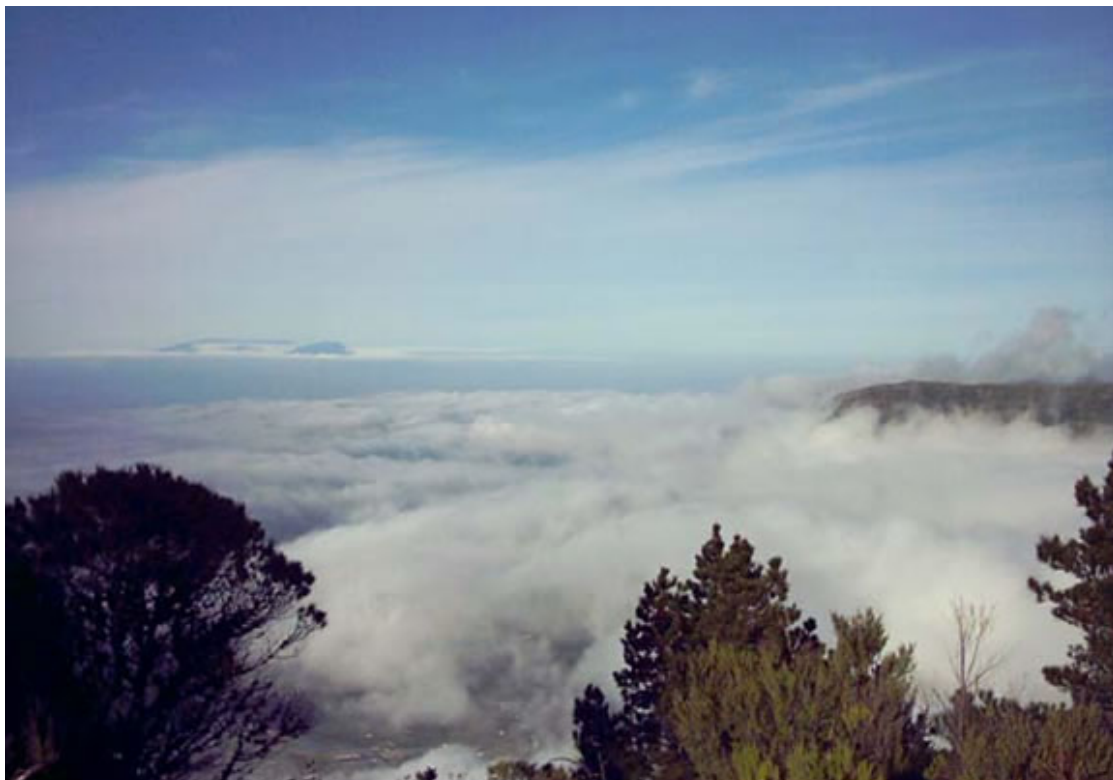
CUMBRE DE MALPASO