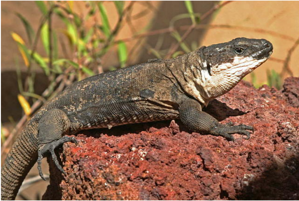
EL LAGARTO GIGANTE DE EL HIERRO

Si antes abordábamos la flora por su impacto en el paisaje, ahora, poniendo el acento en su protección, otro símbolo de esta isla es el lagarto gigante de El Hierro ( Galloisia simonyi ) , especie de grandes proporciones, alcanza los 75 cm., y sólo se encuentra en esta isla. Se sabe que en la antigüedad se distribuía por toda ella, llegando al borde de su extinción en diferentes épocas. En la década de los 70, un pastor de cabras encontró por casualidad algunos ejemplares en la zona de Fuga de Gorreta catalogándose como especie protegida desde 1975. Hoy podemos visitar el lagartario realizado para su conservación en la zona de Guinea en el municipio de Frontera .