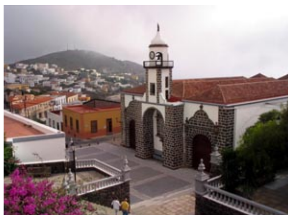
VALVERDE DEL HIERRO

La más pequeña , con una superficie total de unos 270 Km 2 y un perímetro aproximado de 106 Km. su población es el 0,5 % de la población canaria, pertenece a la provincia de Tenerife, estando formada por 3 municipios: