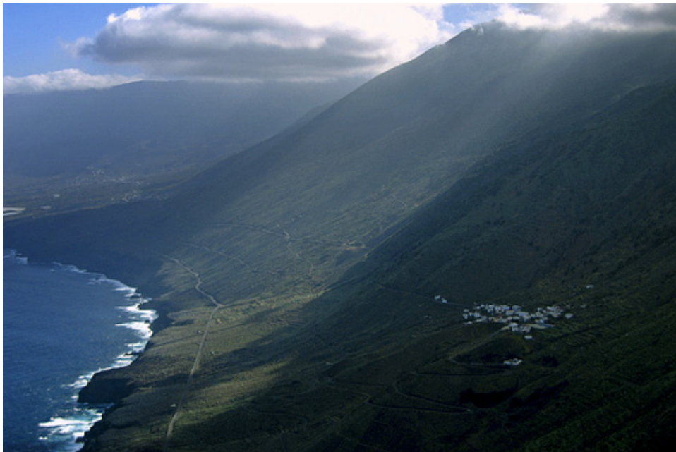
EL GOLFO Y SABINOSA

Hoy día podemos visitar en lo que debió seguir siendo el meridiano 0^{\circ} , el Faro de Orchilla , construido por ser un enclave estratégico para la navegación y en funcionamiento desde 1933.