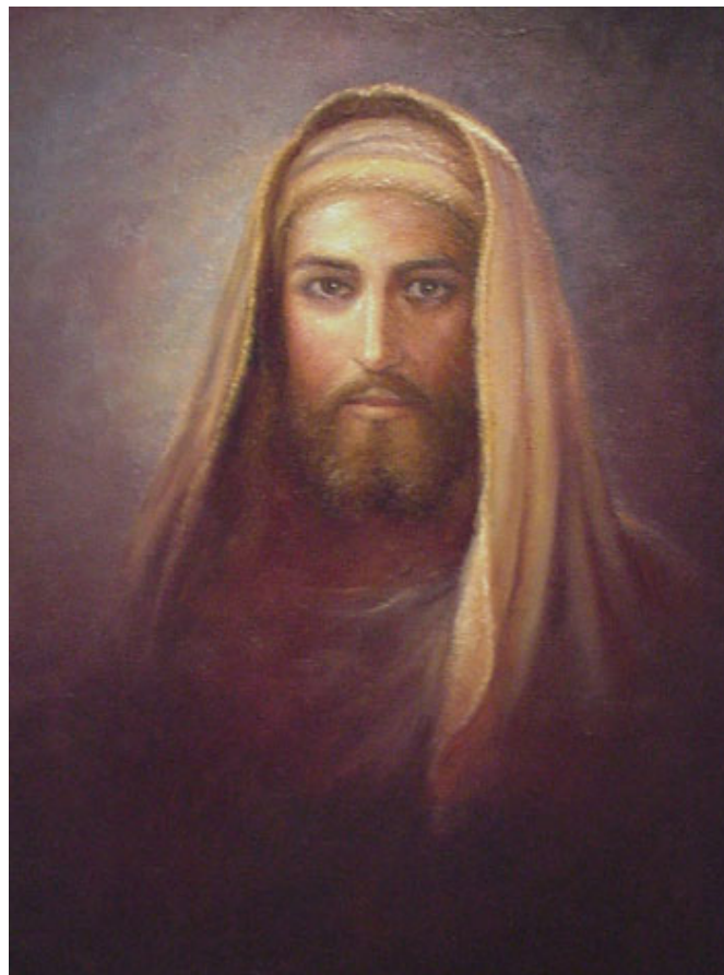
El rostro de Jesús de Nazaret