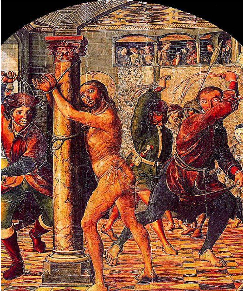
La Flagelación de Jesús-Catedral-Retablo mayor Avila -Pedro Berruguete

Cuando Jesús llegó al monte del Calvario, lugar donde sería crucificado y recibiría la más desfigurante muerte, la de la cruz”, tenía la nariz rota y varias costillas fracturadas por las palizas recibidas, su hombro derecho, estaba