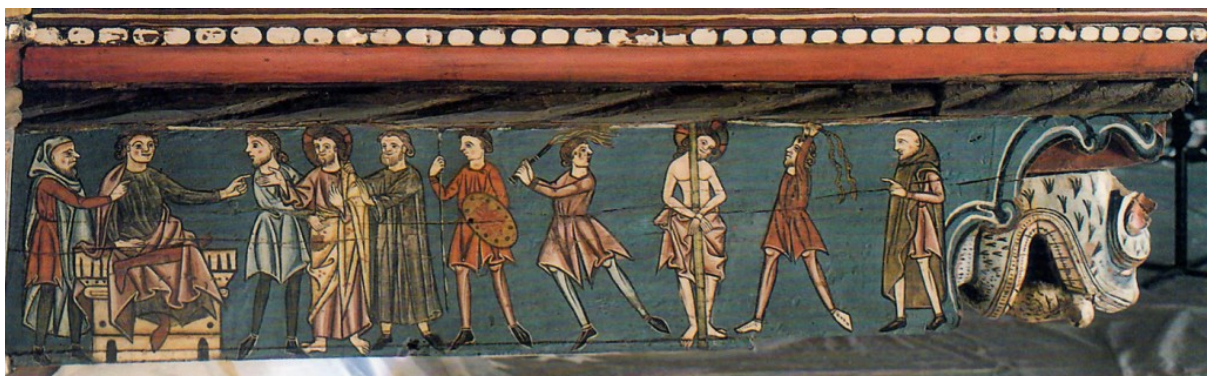
Jesús ante Pilatos y flagelación- Fresco en la catedral de Teruel

Estamos pasando la Semana Santa que conmemora el martirio de un hombre que vivió hace más de 2000 años en una tierra pobre y que él llenó de esperanza. Se trata de Jesús de Nazaret, hijo de José de Nazaret, de profesión carpintero y María, posiblemente nacida en la ciudad helénica de Séforis. Su sufrimiento de Jesús a lo largo de la historia ha sido y es motivo de seguimiento por lo inexplicable del mismo. Sufrió lo inhumanamente posible. Sus heridas hoy en día continúan siendo motivo de estudio, éstas han sido analizadas gracias a la Sábana Santa. Su historia es la de un crimen totalmente injusto cometido por gentes que le envidiaron por el supuesto poder que estaba acaparando.