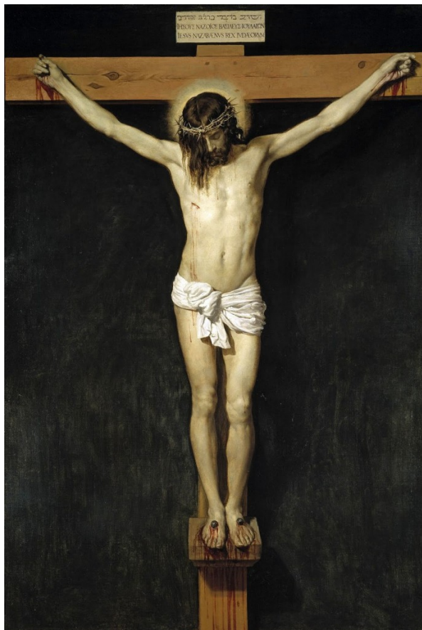
Cristo Crucificado. Oleo de Diego de Velázquez-Museo del Prado. Madrid

quebrado. Pero el soldado romano para confirmar la muerte de Jesús le clavó la lanza en su costado derecho. La lanza atravesó el pulmón derecho y penetró el corazón. Por lo tanto, cuando se sacó la lanza, salió fluido claro, como el agua, seguido de un gran volumen de sangre, tal como lo describe Juan, uno de los testigos oculares, en su Evangelio.