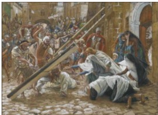
Encuentro en el Camino del Calvario

desollado por el peso del partibulum o palo coro de la cruz, cuyo