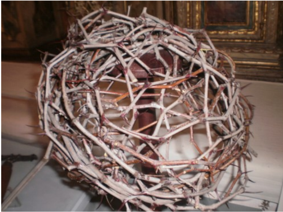
Casco de espinas. Uno como este, tuvo que llevar sobre la cabeza Jesús de Nazaret

Las punciones en todo el cuero cabelludo nos muestran que fue, no una corona como se nos muestra en las iconografías, si no un casco de púas de espino que llevó en la cabeza durante algunas horas. Los romanos lo pusieron en la cabeza de Jesús en plan de mofa por ser “rey de los judíos”.