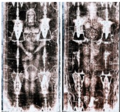
Sábana Santa de Turín (Italia)

pies los juntaron y brutalmente fueron atravesados a la altura del empeine por un solo clavo.