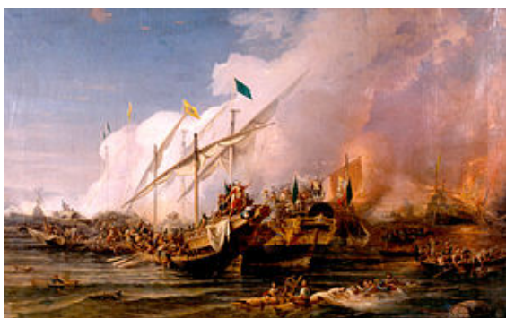
Victoria de la Preveza (1538)

Belgrado, llegó a Viena (1529), sin doblegarla. En el Mediterráneo su avance fue constante (victoria de la Prevesa, 1538). Debido a la ruptura de la coalición cristiana (Venecia, Papado, Carlos V), a éxitos españoles (toma de Túnez, 1535), siguieron reveses decisivos