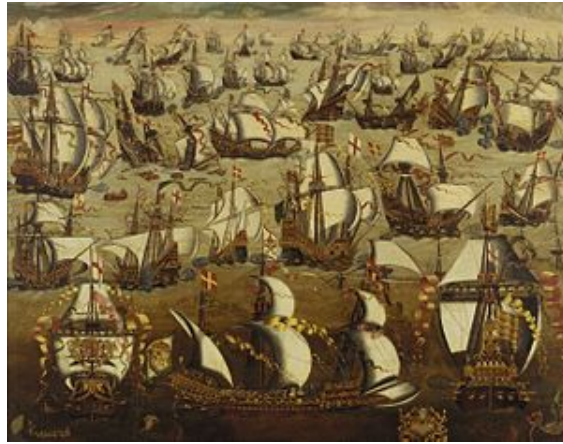
La Armada Invencible

sabel I, presintiendo que Inglaterra podía ser objetivo español, tras saber de los acuerdos entre los católicos franceses (duque de Guisa) y España y del avance en Flandes, ayudó los calvinistas. Se enviaron 6000 soldados, que fueron derrotados. A pesar de ello el apoyo siguió con el saqueo del litoral flamenco, a manos de corsarios pagados por la corona inglesa. Esta descarada actuación motivó a Felipe II a enviar la “Armada Invencible” , para