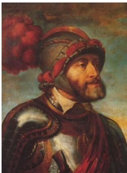
El Emperador Carlos V

imprensa (Guttemberg, Maguncia 1436), y el libro como base de la transmisión del conocimiento. Se editarán a los clásicos en Basilea, París, Venecia o Amberes, difundiendo uniformemente las nuevas tendencias en toda Europa.