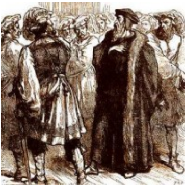
Calvino rodeado de sus enemigos

propio poder, frente al arcaico modelo concepto imperial, pues aglutinaba a sus respectivos pueblos alrededor de principios comunes, que afectaban a lo más íntimo de las conciencias y que ellos podían manipular al erigirse como sus principales adalides.