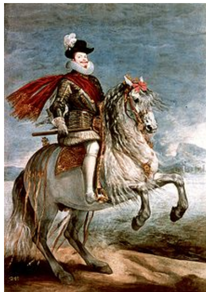
Felipe III, rey de España. Pintura de Velázquez-Museo del Prado

de Parma, Felipe II, nombró a su yerno el archiduque Alberto de Austria, gobernador. Muerto el rey (1598), él y su esposa Isabel Clara Eugenia, se convirtieron en soberanos de los Países Bajos, tutelados por España. Al desaparecer Orange, su hijo Mauricio, reorganizó a los calvinistas, derrotando al ejército español, por primera vez (Nieuwpoort, 2 julio 1600). Mientras, Francia, con el triunfo de Enrique IV, se zafaba del control de su vecino. La obra del fallecido monarca se desintegraba.