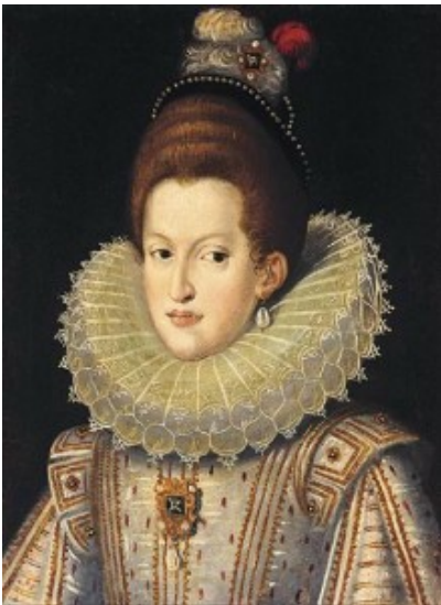
La reina de España Margarita de Austria (1584-1611)

el ideal flamenco de la existencia, muy unido a su espíritu empresarial, lo que relacionó al “ despótico ” catolicismo hispano con el decaimiento comercial y una brutal inflación debido a la falta de trigo que había originado una crisis de subsistencias ,Esto dio a la revuelta un tinte independentista. La miseria fue concienzudamente manipulada por los calvinistas quienes, censuraron las prebendas de los clérigos de Roma.