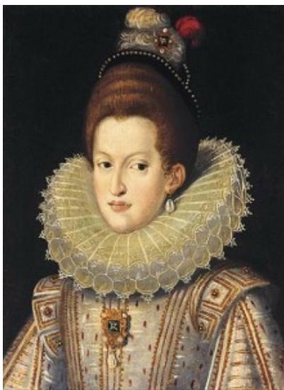
La reina de España Margarita de Austria (1584-1611)

el ideal flamenco de la existencia, muy unido a su espíritu empresarial, lo que relacionó al “ despótico ” catolicismo hispano con el decaimiento comercial y una brutal inflación debido a la falta de trigo que había originado una crisis de subsistencias ,Esto dio a la revuelta un tinte independentista. La miseria fue concienzudamente manipulada por los calvinistas quienes, censuraron las prebendas de los clérigos de Roma.