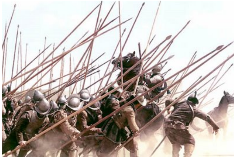
Tercios de Flandes

El 1 de abril de 1572, Orange asaltó los puertos de Brielle (núcleo fortificado de la Holanda meridional), Flesinga (isla de Walcheren, Zelanda) y Enkhuizen (Holanda septentrional). Su objetivo era obstaculizar el comercio y que las provincias de Zelanda, Holanda, Frisia, Güeldres y Utrecht, se les uniesen. La reacción española fue contundente con la toma, saqueo o destrucción de varias poblaciones (Mons, Haarlem, Malinas, Zutphen, Nanarden, Alkmaar, etc.). En el verano de 1573, un firme Felipe II decidió pactar. Nombró a don Luis de Requesens nuevo gobernador, quien negoció en Breda con los moderados y liquidó el “Tribunal de la sangre” . Por