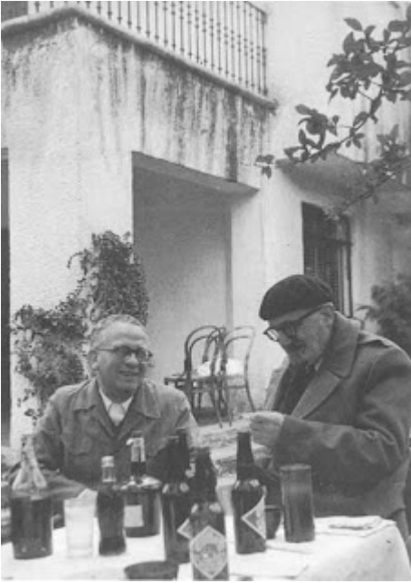
Max Aub y León Felipe

En él podemos apreciar desde el niño (León Camino Galicia de la Rosa), que naciera (1884) en la zamorana villa de Tábara, hasta el hombre que falleciera (1968) en la ciudad de Méjico, pasando por el circunstancial farmacéutico de un pueblo castellano-manchego, y aquél que en época republicana se identificara plenamente con su gobierno, y siempre llevara consigo la identidad del gran poeta (León Felipe), que aseguraba no tener biografía. La existencia echó candado en el conjunto unitario del hombre y el soñador, sin que separarse pudiera jamás uAseguranno del otro. Si esta simbiosis no fuera una evidencia, suponemos que alguien pensaría que no tenemos razón ahora para recordarla pluralmente en La Alcazaba ; por eso redundo en su doble unidad.