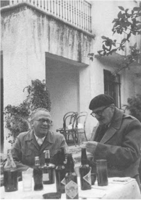
Max Aub y León Felipe

En él podemos apreciar desde el niño (León Camino Galicia de la Rosa), que naciera (1884) en la zamorana villa de Tábara, hasta el hombre que falleciera (1968) en la ciudad de Méjico, pasando por el circunstancial farmacéutico de un pueblo castellano-manchego, y aquél que en época republicana se identificara plenamente con su gobierno, y siempre llevara consigo la identidad del gran poeta (León Felipe), que aseguraba no tener biografía. La existencia echó candado en el conjunto unitario del hombre y el soñador, sin que separarse pudiera jamás uAseguranno del otro. Si esta simbiosis no fuera una evidencia, suponemos que alguien pensaría que no tenemos razón ahora para recordarla pluralmente en La Alcazaba ; por eso redundo en su doble unidad.