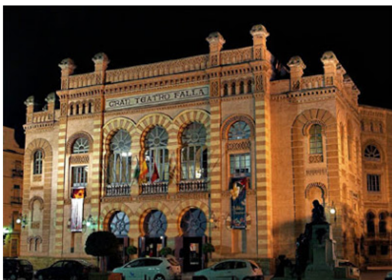
Teatro Falla: cumbre del carnaval de Cádiz

del dios Baco, las saturnales: en honor del dios Saturno y las lupercales: en honor del dios Pan, celebraciones en la antigua Grecia y en la Roma clásica. Julio Caro Baroja, uno de los más clásicos estudiosos del Carnaval, lo define como «un hijo del cristianismo». Todos sabemos que el Carnaval se celebra previamente a la Cuaresma, es el fin de semana anterior al Miércoles de Ceniza. Y es una consecuencia de la concepción simple del tiempo que adopta el cristianismo. Una concepción ajustada a los ciclos vitales y de las cosechas.