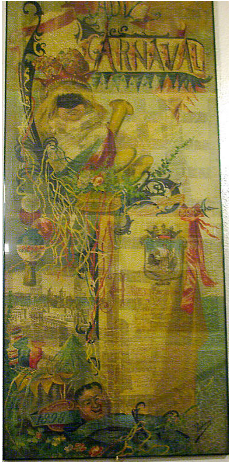
CARTEL CARNAVAL DE CADIZ 1898

El disfraz invierte el orden de las cosas, comiendo, bebiendo, ironizando y satirizando a la sociedad y a la autoridad. En definitiva, da rienda suelta a la fantasía y a la libertad. El Ayuntamiento no reconocía el Carnaval como una fiesta propia hasta que en el año 1861 el alcalde Don Juan Valverde propone que sea el Cabildo el encargado de la organización del Carnaval, para lo que se solicita que en el presupuesto de 1862 se previeran los gastos del Carnaval. Podemos decir que