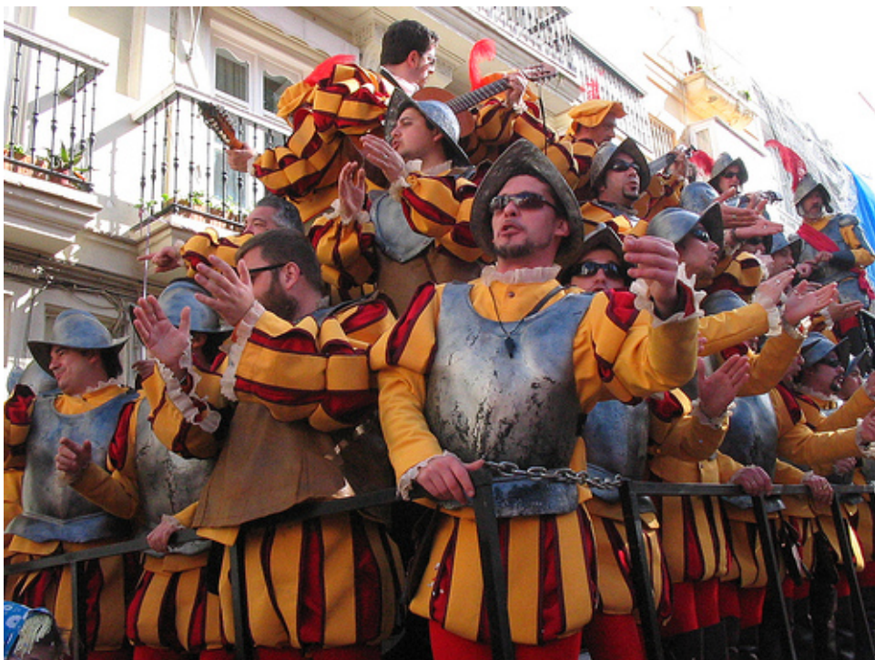
AGRUPACIÓN DE CHIRIGOTAS POR LAS CALLES DE CÁDIZ