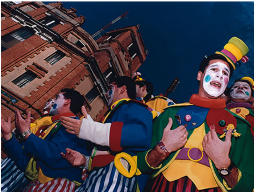
AGRUPACIÓN DE CHIRIGOTAS

Estas Agrupaciones de conjuntos músico vocales que cantan repertorios propios y de marcado carácter gaditano se irán convirtiendo paulatinamente en uno de los ejes del Carnaval de Cádiz, sin olvidar los bailes de máscaras y -sobre todo- la calle como elementodinamizador de la participación popular.