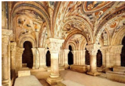
Pateón de los Reyes en la Basílica de San Isidoro, León

En León o en Astorga palacios de Blancanieves construidos por Gaudí, o el ayuntamiento de esas ciudades llenos de armonía, aunque en León han construido uno que dicen que es más funcional, pero deja mucho que desear.