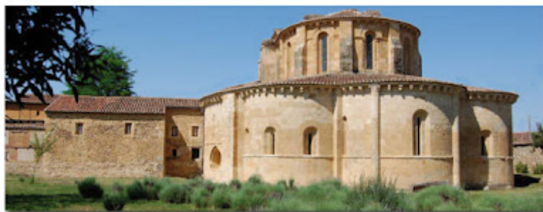
Santa María de Gradefes, León

Pero la historia surge por todas partes, historia militar mezclada con la vida espiritual, pues en todas partes se encuentran fortalezas hechas iglesias románicas. El románico es el espíritu de oración recogido en todo el norte de Palencia, mezclado con la luminosidad del gótico esplendoroso de la catedral de León. Luz, luz para iluminar la oración y que llegue a lo más alto, como las ojivas que sujetan tanta altura.