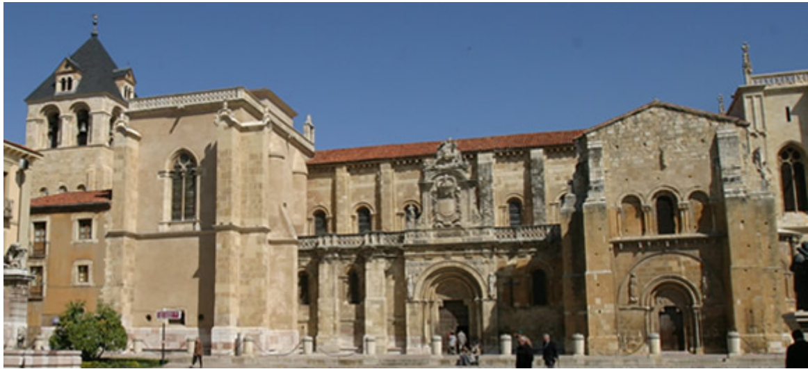
Basílica de San Isidoro, León