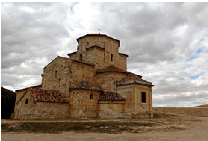
Nuestra Señora de la Anunciada, Urueña, Valladolid

De vez en cuando un río culebrea por las llanuras castellanas, por la Vieja Castilla. Esta tierra posee numerosos ríos con nombres que son historia: el Adaja, que pasa por Ávila y Arévalo; el Torío y Bernesga, por León, el Carrión, atravesando la bella ciudad de Carrión de los Condes; el Duero, largo como él solo, río que nace en Soria y va a morir a Portugal; el Zapardiel en Medina del Campo y el Jerga por Astorga. Ríos con sonoridad de historia: Pisuerga, Órbigo, Cea, Esla, Valderaduey. ¡Cuánta historia almacenan estos nombres! Pero qué escasez de vida en los campos, cuanta soledad en sus páramos solitarios. De vez en cuando un arbusto, un árbol, junto al río para recuerdo de que existen. O un pinar que alegra el paisaje, como en Arévalo.