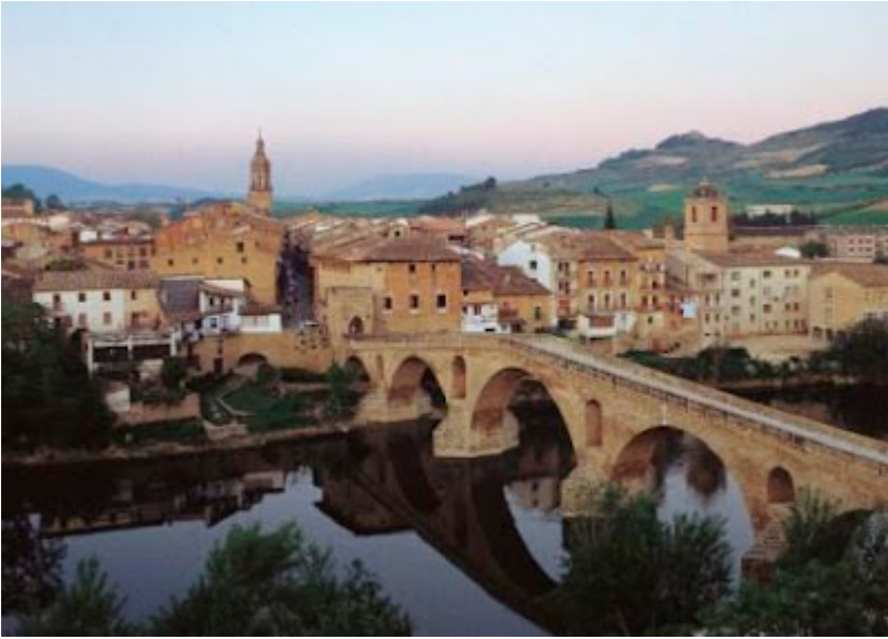
Puente de la Reina, Navarra

El Camino de Santiago nos llena de aventuras, de arte, de geografía y de historia, nos hace conocer una importante parte de una España maravillosa, cuando otros se alejan a países exóticos, a playas donde la muchedumbre se aglomera como en manadas de pingüinos, sin espacios abiertos.