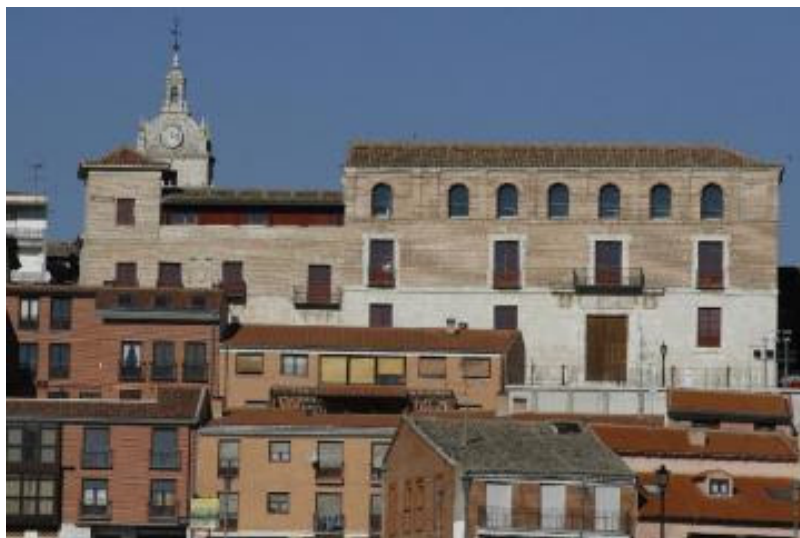
Casa del Tratado de Tordesillas, Tordesillas, Valladolid

Algunas poblaciones alojan paseos de bellas arboledas, como el que se alinea junto al Bernesga en León, paseo de castaños donde se recrean los viejos con sus viejos recuerdos; donde pasean sentados en sillas de ruedas personas que perdieron su capacidad de moverse, como los pueblos de Castilla que han olvidado en muchas ocasiones que existe el progreso.