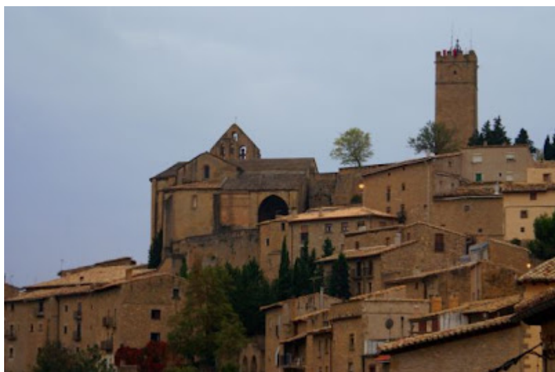
Sos del Rey Católico, Zaragoza

par catedral de Santiago y ganar el jubileo. Otros hacen los kilómetros finales, lo cual no tiene mérito, pues caminan y luego les recoge un coche para llevarles al lugar de dormir. Los hay que vienen del extranjero para recorrer las tierras hispanas y entrar en la profundidad de las mismas, unos a pie, otros en bici. Mérito verdadero, pues ni los españoles se atreven a llevar a cabo semejante proeza.