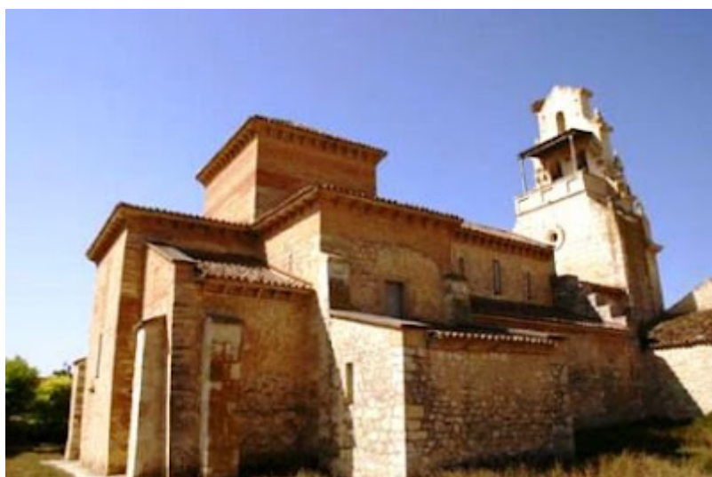
San Cebrian de Mazote

Las mimosas han perdido su electricidad amarilla anunciando el comienzo de la primavera. Los almendros dejaron de florecer para proporcionarnos su fruto y poder almacenarlo para las fiestas de navidad. Sus almendras nos darán unos turronec exquisitos, llenos de recuerdos de la infancia, cuando solamente existían el “duro” y el “blando”. A mi me gustaba más el duro, pero ahora prefiero el blando. Las muelas no me dejan apreciar toda su sabiduría, todo el color de su sabor. Pero no importa, el blando llena lo mismo que el otro.