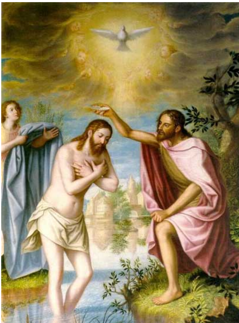
Bautismo de Cristo

que fueron realizadas, mientras que el resto se encuentran en el museo de Granada. De ellas destacan las dos series narrativas de la historia de la Orden, la de sus orígenes según la leyenda, y la crónica de los primeros mártires de Inglaterra.