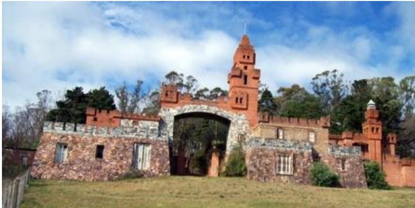
Castillo e Pittamiglio de las Flores

Otros iconos turísticos relevantes son: el Tour Místico, la Cueva del Ave Fenix, ubicada al pie del Cerro del Inglés; Virgen de los pescadores Stella Maris, ubicada en la falda del Cerro de San Antonio y el Castillo Pittamiglio, obra de este alquimista del siglo XX.