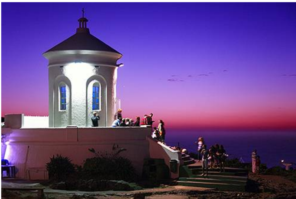
Ermita de San Antonio en el cumbre del cerro que lleva ese mismo nombre

gran tradición turística y su diversidad de propuestas. Cerros impresionantes, restaurantes, paseos culturales, construcciones históricas, movida nocturna y preciosas playas explican por qué Piriápolis es siempre un favorito en la costa de Maldonado