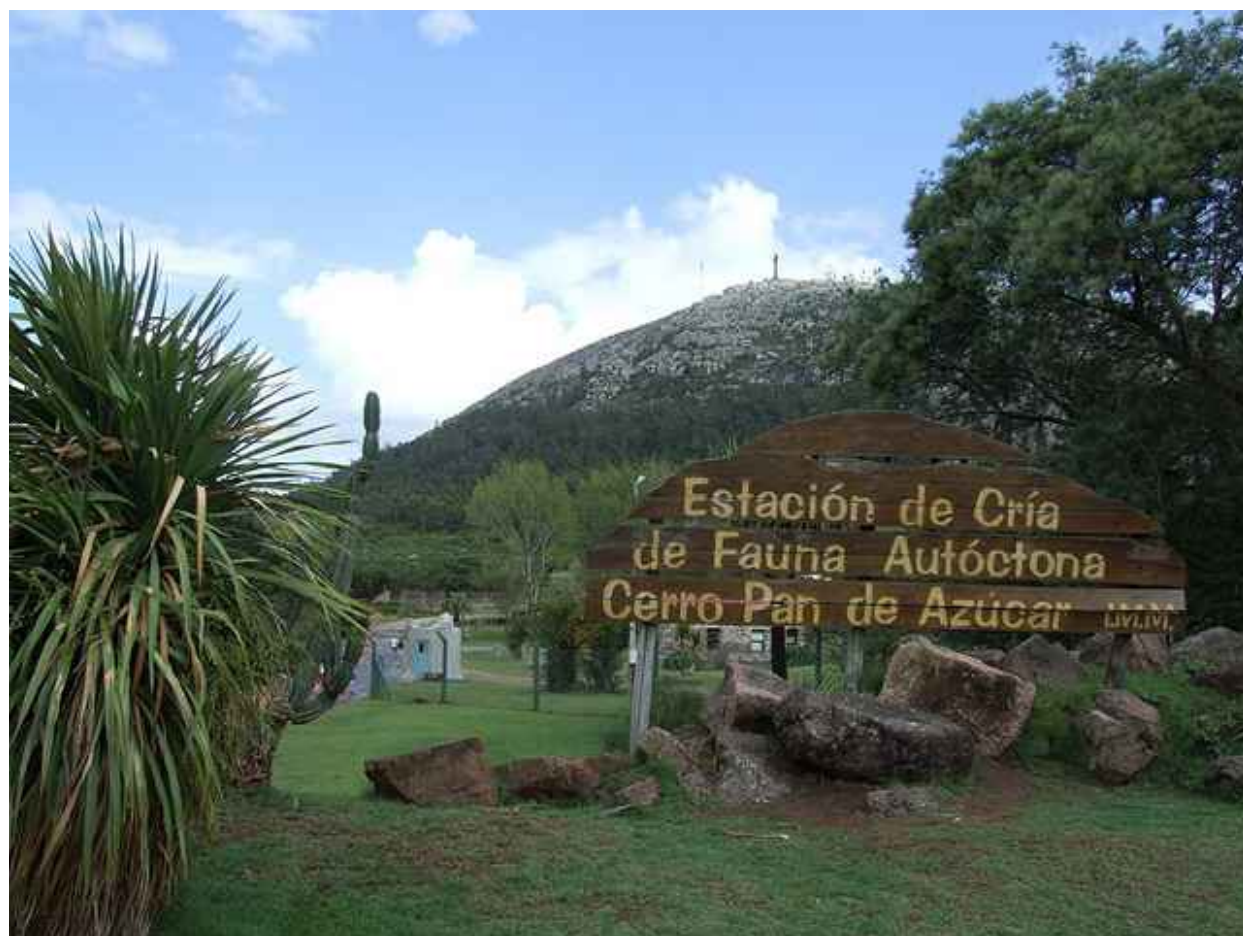
Estación de Cría de Fauna Autóctona del Cerro Pan de Azúcar

auto por la cantidad de personas que transitan y conviven en sus parajes.