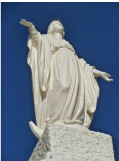
Virgen de los pescadores

Otros iconos turísticos relevantes son: el Tour Místico, la Cueva del Ave Fenix, ubicada al pie del Cerro del Inglés; Virgen de los pescadores Stella Maris, ubicada en la falda del Cerro de San Antonio y el Castillo Pittamiglio, obra de este alquimista del siglo XX.