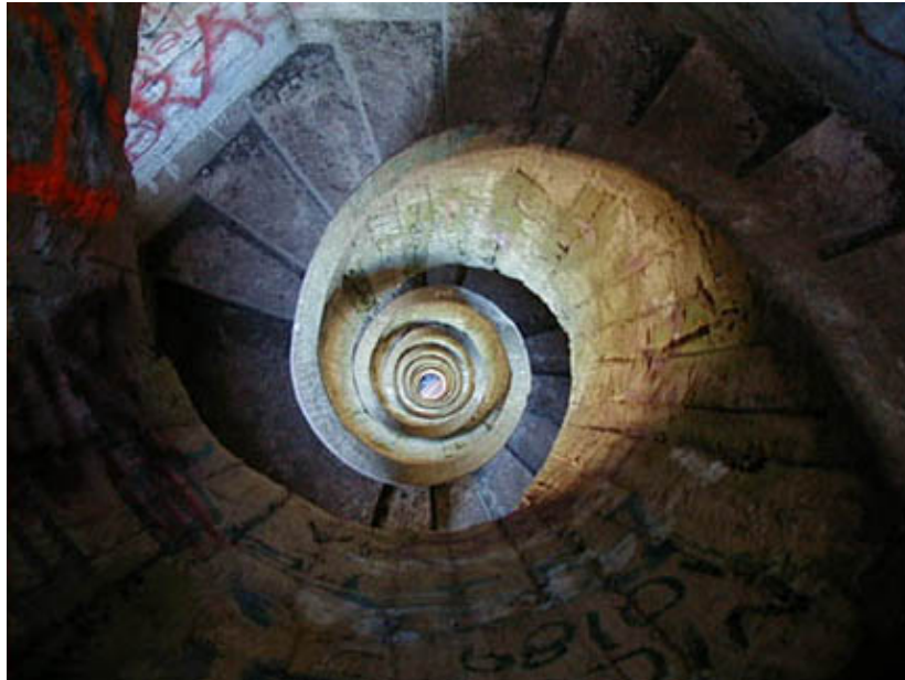
Cruz y escalera de su interior del Cerro del Pan de Azúcar

Otra atracción propia de esta ciudad es subir los cerros . Como estas elevaciones son redondeadas no es posible calcular su verdadera altura que engaña a la vista de los visitantes.