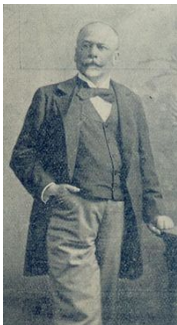
Fernando Juan Santiago Francisco María Piria de Grossi (Montevideo, 21 de agosto de 1847 – 11 de diciembre de 1933)

llamada Piriápolis, con una atmósfera inolvidable-