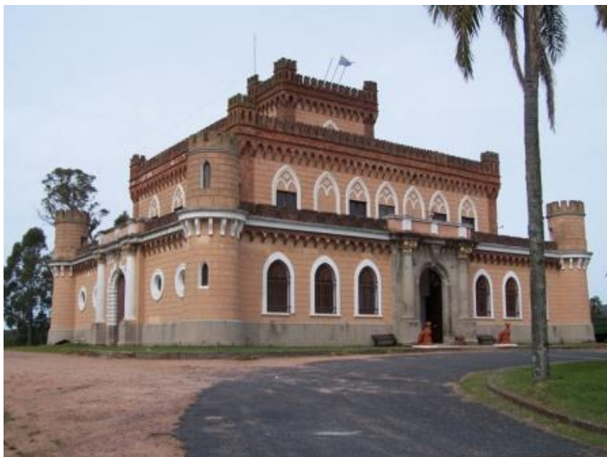
Castillo de Piriápolis

para meditar o conectarse con sitios de poder. Un entorno de gran belleza natural, junto con una gran tradición turística se combinan en esta ciudad para recibirte a disfrutar de sus playas y cerros, su historia, su entorno y su gente.