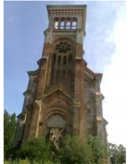
Antigua iglesia de Piriópolis