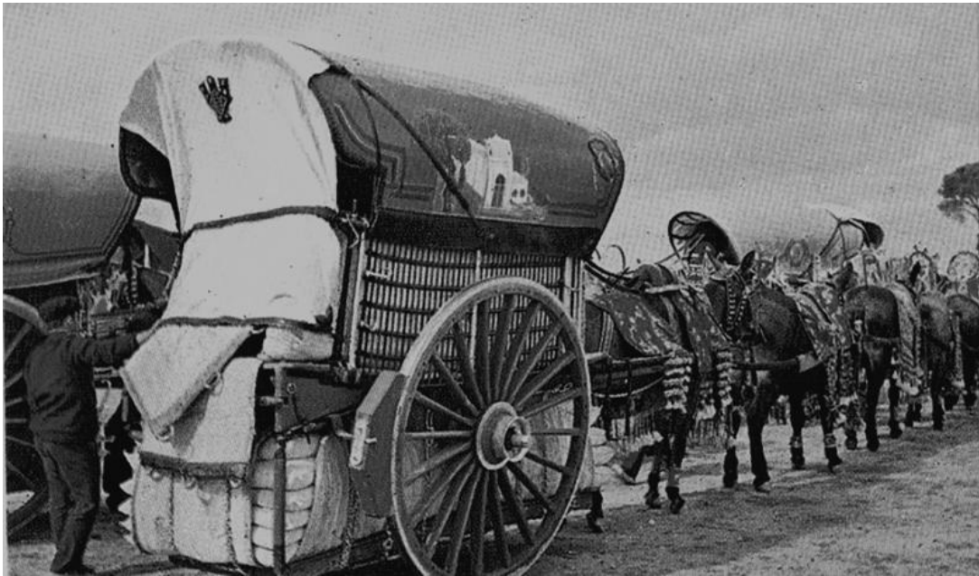
CARRO DE TOLDO

Los carreros de Tomelloso son locos quijotes que ponen su dinero y su esfuerzo al servicio de la recuperación de la mula. La mula para ellos representa una forma de vivir. Es el testimonio de una etapa donde esos animales de carga, resistentes y tenaces, fue en sus vidas constatación de su valía personal. Crecieron entre sus patas. Soñaron con ser hombres al calor de sus cuerpos en las noches largas de las casas del campo, o bajo la bóveda de piedra de los bombos. Nadie les preguntó en la infancia, si querían crecer de aquella manera. Nadie les dio otra oportunidad. Niños gañanes. Niños duros. Niños con escasa ternura entre sus ojos adolescentes. Niños de Tomelloso, de este pueblo que solo existe gracias al amor de sus gentes.