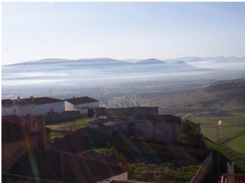
VISTAS DESDE EL CERRO DEL CASTILLO

la reconquista castellana -hacia el 1214-, la villa pasa a poder de la Orden Militar de Santiago, integrada en la encomienda de Segura de la Sierra, hasta que en 1566 logra su independencia de esta última y el villazgo, al tiempo que el vetusto castillo pierde su interés militar. Situación jurisdiccional que se mantendrá sin cambios hasta los primeros años del siglo XIX, en que las Cortes de Cádiz declaran la abolición del régimen señorial. Luego de 1833, Albaladejo es uno más de los municipios que forman la provincia de Ciudad Real