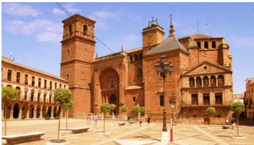
PLAZA MAYOR DE VILLANUEVA DE LOS INFANTE, CON LA IGLESIA DE SAN ANDRÉS APOSTOL

Los infanteños e infanteñas, están orgullosos de tener los restos de Don Francisco de Quevedo y Villegas, . También se puede encontrar paseando por sus medievales calles con la Casa del Caballero del Verde Gabán, citada en el capítulo XVIII de la 2ª parte de nuestro Quijote de Cervantes, y con la Casa del Marqués de Camacho, El Palacio de Melgarejo, o la casa cuartel de los Caballeros de la Orden de Santiago, sin olvidarnos del Palacio de Revuelta y el Covento de la Encarnación, o la casa de la Inquisición, el convento de Trinitarios y la Casa de Arcos que perteneció a JuanOrtega Montáñez, Arzobispo y Virrey de México y pariente del santo, Santo Tomás de Villanueva. Si salimos un poco por sus campo, nos tropezaremos con la cultura romana, representada en estas tierras por yacimiento arqueológico de Jamilla