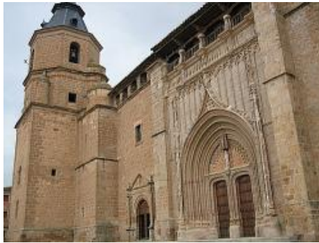
IGLESIA PARROQUIAL NUESTRA SEÑORA DE LA ASUNCIÓN. EN SU INTERIOR ALBERGA UN ÓRGANO DEL SIGLO XVIII

uno de los tesoros de la Villa, su iglesia, dedicada a Nuestra Señora de la Asunción, es de estilo gótico florido (siglo XV-XVI) con elementos barrocos y renacentistas