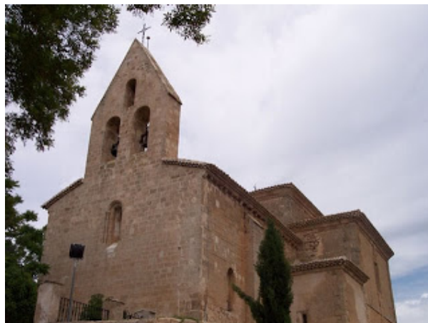
Albarate de las Nogueras

Sin embargo, es digno de resaltar como la la distinta utilización de materiales y la absoluta popularización del estilo nos lleva a una enorme individualidad y diversidad de matices, de forma que, frente a los bellos ábsides realizados en sillar, de arquitectura culta en las iglesias de Monsalud en Córcoles, Santa María de Atienza en Huete y Valdeolivas, encontraremos otras con elementos mucho más pobres, como Albendea y Alcantud.