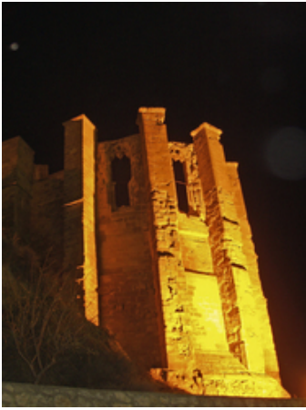
Huete, iglesia de Nuestra Señora de Atienza

Por otro lado, no es nada extraño analizar como en la Tierra de Huete aparecen pocos edificios de tipología románica y escaso número de iglesias comparadas con el Común de Cuenca. En realidad, habría que pensar que la construcción de edificios no fue tan sistemática como podría ser en otras zonas ya comentadas y es lógico pensar que así fuera, ya que la repoblación de este alfoz se vió varias veces malograda por los constantes ataques sufridos y que, sin duda, arrasaría edificios románicos ya construidos.