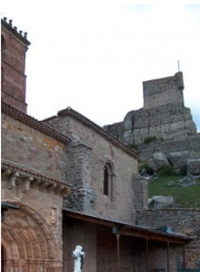
Atienza, Santa María

Por otro lado, no es nada extraño analizar como en la Tierra de Huete aparecen pocos edificios de tipología románica y escaso número de iglesias comparadas con el Común de Cuenca. En realidad, habría que pensar que la construcción de edificios no fue tan sistemática como podría ser en otras zonas ya comentadas y es lógico pensar que así fuera, ya que la repoblación de este alfoz se vió varias veces malograda por los constantes ataques sufridos y que, sin duda, arrasaría edificios románicos ya construidos.