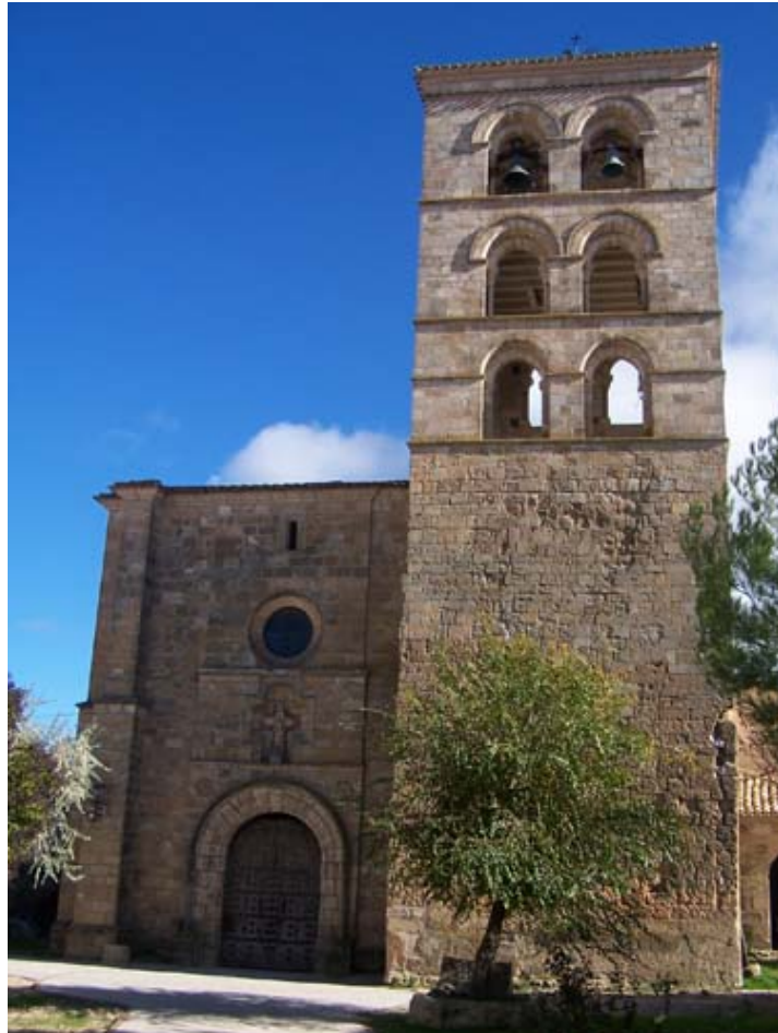
Iglesia de Valdeolivas

Respecto a la espadaña, de traza triangular, será el elemento más común en toda esta zona, a excepción de la única torre campanario románica en Valdeolivas o, quizás, el primer cuerpo de la iglesia de Alcocer. Solamente en dos edificios de toda la zona a comentar encontramos con cripta, la de Santa María de Atienza de Huete, con espacios residuales resultantes del desnivel del terreno y la de Llanes de Albendea, que es una verdadera cripta con planta de cruz, que se resuelve con bóvedas de cañón.