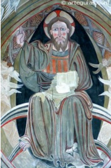
Pantocrator en Valdeolivas.

Tal es así que las características de esta arquitectura que podríamos definir como localista y popular por su programa y ejecución, podríamos generalizarlas a todas siguiendo un esquema único a excepción de aquellos núcleos de población cuya influencia de la orden Cisterciense, ámbito del monasterio de Monsalud, pudieran dejarse notar.