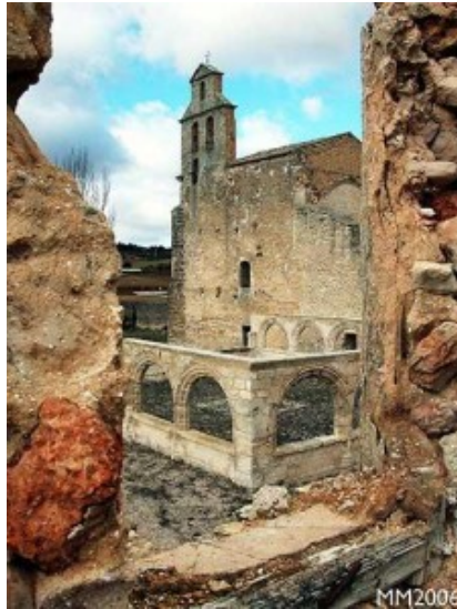
Convento de Priego.

Y es que, hablar del condado de Priego, o de aquellas tierras del Infantado, o de la Huete capitalina, es hablar de sentimiento, de tradición, de honradez y de arte.