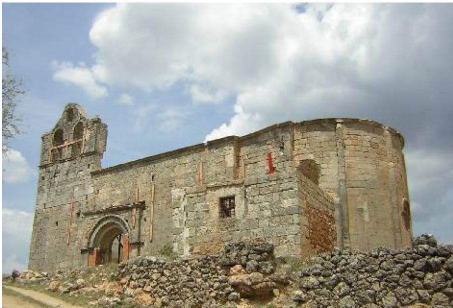
Villaescusa de Polositos

Cierto es que el carácter repoblador de estos lugares, núcleos pequeños, determinará que las portadas sean de pequeño tamaño, al igual que sus iglesias, sin embargo, perfectamente acopladas al muro meridional, y caracterizadas por el tipo de arco utilizado, darán el aporte señorial a unos edificios vetustos y perfectamente armonizados.