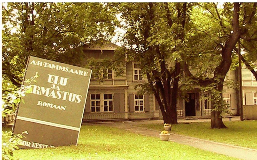
Casa de Tammsasare

lo que está apasionadamente a nuestro alcance.