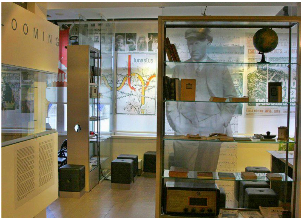
Museo de Tammsaare

ediciones de sus obras y las traducciones extranjeras. Siempre te da melancolía ver que alguien a quien apenas conocías hasta ese momento ha llenado la vida de personas y países. Y era alguien tan querido en Estonia, tan esmeradamente protegido en su casa. Mirábamos todo aquello con detallismo, con exquisitez, y a las empleadas les gustaba que tuviéramos tanto interés. Daba gusto estar allí, como si el escritor viviera ahora mismo, y sentir el toque intimista de su mujer, y mirar por las ventanas la serenidad del jardín como si él mismo lo estuviera arreglando.