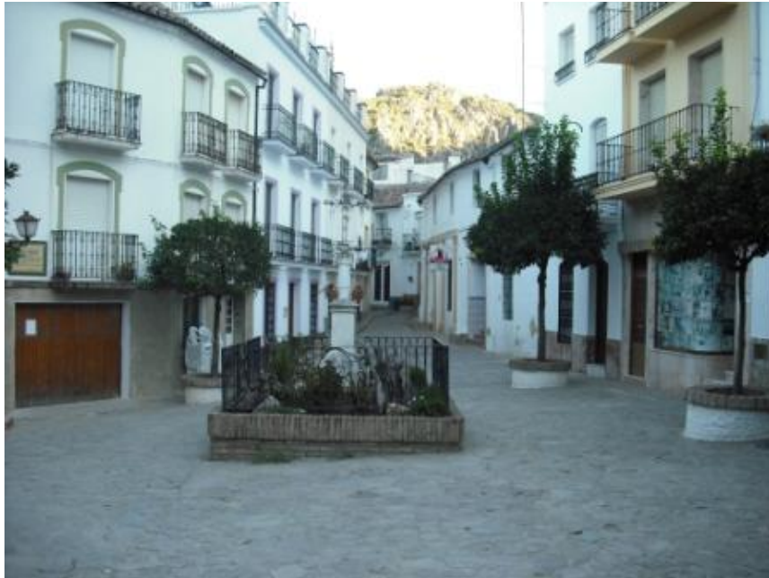
Plaza de la Verdura.

El Certamen Regional de Pintura Villa de Ubrique, el Concurso de Pintura al Aire Libre Las Cuatro Esquinas, el Concurso Nacional de Arte Flamenco o la prueba automovilística Subida Internacional Ubrique que puntúa en el Campeonato Nacional y Andalúz de Montaña, son algunos de los importantes eventos que tienen lugar a lo largo del año y que atraen a un importante número de público específico según la actividad.