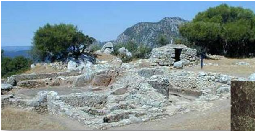
Ciudad romana de Ocuri