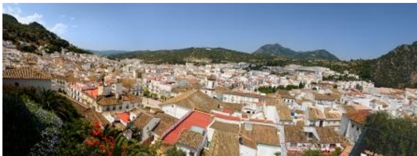
Vista general de Ubrique