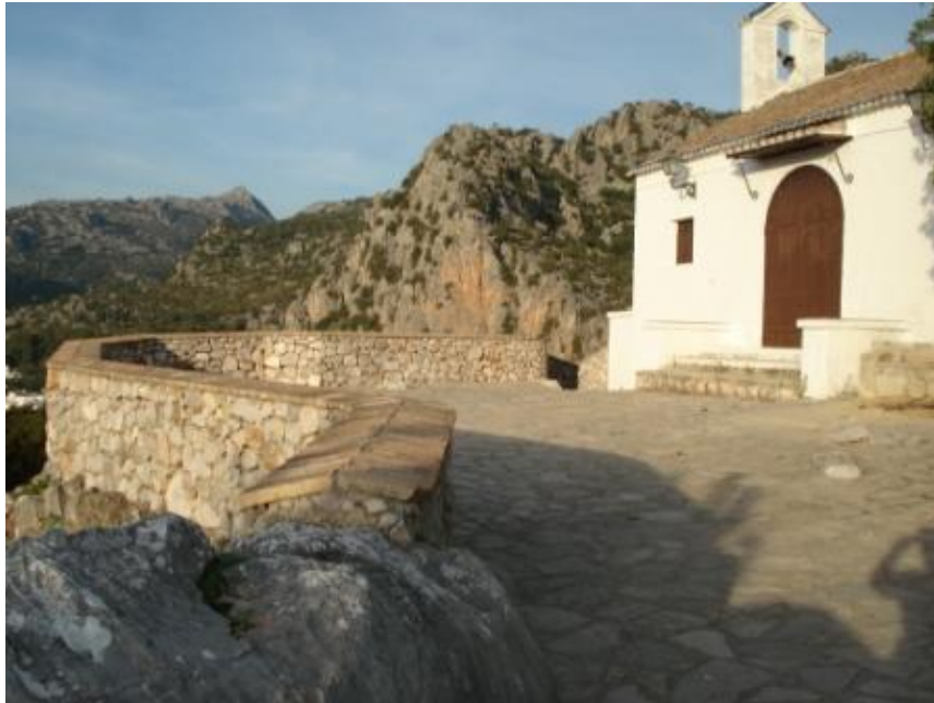
Mirador ermita del Calvario.

Estos dos miradores junto con los de la ermita del Calvario, Las Cumbres, Antigua Viña del Perro, Mojón de la Víbora y Los Olivares, conforman la Ruta de los Miradores de Ubrique, sendero de fácil acceso que se convierte en toda una actividad deportiva si se pretende recorrerlo en su totalidad. La Calzada Romana o el Callejón de las Mocitas son algunos de los paseos que se pueden emprender desde Ubrique así como otras actividades de deporte de naturaleza que ofrecen los Parques Naturales Sierra de Grazalema y Los Alcornocales, a los que Ubrique pertenece.