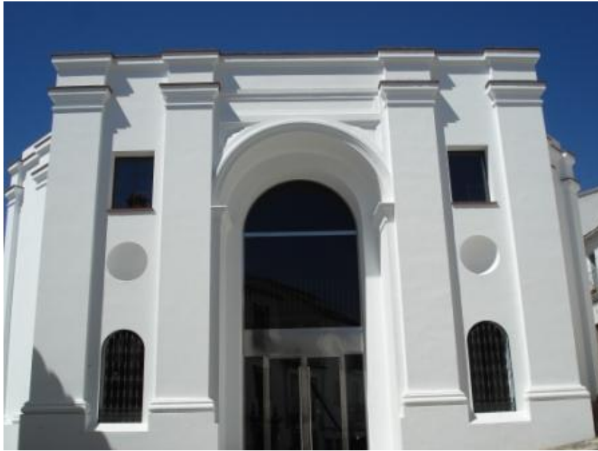
Iglesia de San Juan de Letrán. Actual Centro de Interpretación de la Historia de Ubrique.

Por ellas se erigen la mayoría de los edificios más importantes de Ubrique. Desde el Convento de Capuchinos (s. XVII) donde pasó gran parte de su vida Fray Diego José de Cádiz y donde se encuentra el Museo de la Piel, pasando por San Juan de Letrán (s.XVII), actual Centro de Interpretación de la Historia de Ubrique o la ermita de San Pedro (principio s.XIX), cuyo autor, Miguel Olivares y Guerrero, fue aparejador de la Colegiata de Jerez de la Fra. y arquitecto de la Catedral de Cádiz. Junto a ésta, la Iglesia de Nuestra Señora de la O, Parroquia de Ubrique que alberga importantes obras escultóricas como el Crucificado de Castillo Lastrucci o la Virgen de la O de Jerónimo Hernández (s.XVI) o Virgen de los Dolores del siglo XVII entre otras. Frente a este edificio religioso, al otro lado de la plaza, el Ayuntamiento de estilo neoclásico y la Fuente del s.XVIII que dan paso a la Plaza de la Verdura por donde pasaba el antiguo Vía Crucis y que abre puertas hacia el entramado de resplandecientes callejuelas y los rincones más pintorescos del Casco Antiguo. Paseando por él llegaremos al Peñón de la Becerra, arquitectura popular que fue escenario en el año 1949 del rodaje de la película "Las