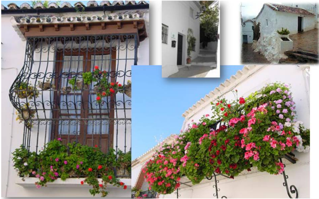
Imágenes de las calles y balcones de Ubrique engalanados con flores