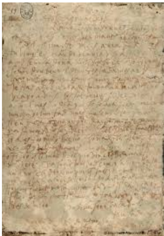
Carta de Santa Teresa de Jesús a Don Álvaro de Mendoza, fechada en Medina del Campo 6 de Julio de 1568

familiar judío; su “yo infantil” o su yo débil excluyó del plano de la conciencia su vinculación judía. En el caso de la Santa significó un complejo de judaísmo, dato que fue un enigma en su vida hasta el siglo XX. Hoy por hoy se acepta la idea de que el abuelo de Santa Teresa fue un judío converso. Su madre murió cuando ella contaba tan solo con 13 años.