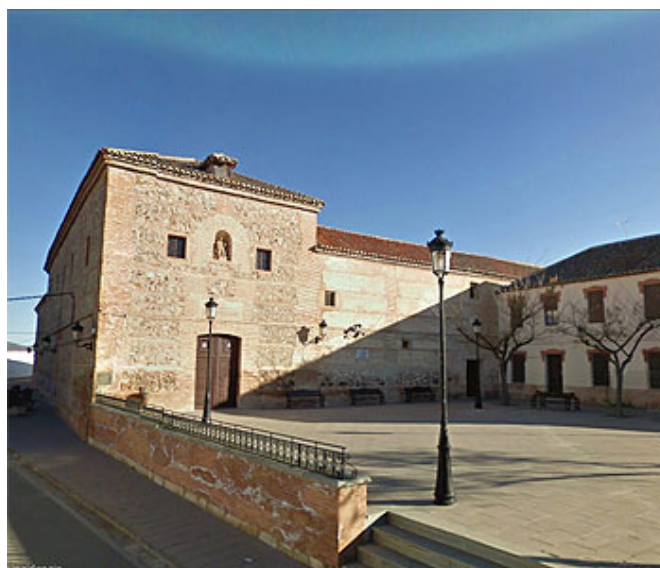
Convento Carmelita fundado por Teresa de Ávila en Malagón, Ciudad Real, en 1562

dos conventos de frailes carmelitas descalzos; al mismo tiempo se fundan otros conventos masculinos, pero sin intervención directa de Teresa.