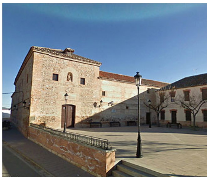
Convento Carmelita fundado por Teresa de Ávila en Malagón, Ciudad Real, en 1562

dos conventos de frailes carmelitas descalzos; al mismo tiempo se fundan otros conventos masculinos, pero sin intervención directa de Teresa.