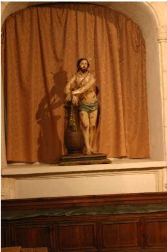
Jesús esperando ser azotado. Imagen de Salcillo

alberga edificios importantes. Entre sus plazas, la mayor con el Pósito y su ajardinamiento actual dándole entrada su arco de sillería que ajustaba el caserío en aquellos años del XVI, realzando todo el entramado. Pero es su iglesia la que significa el lugar. Dedicada a San Pedro Apóstol, de traza con-catedralicia en sus pináculos y arbotantes, es