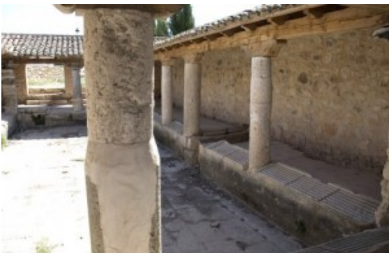
Lavaderos públicos de Villaescusa de Haro

Sin embargo y aunque tuvo tiempo para ser capital de concejo con las aldeas de Haro, Villar de la Encina, Carrascosa y Rada bajo su jurisdicción, es, en tiempos de los Reyes Católicos cuando quedaría exenta de toda jurisdicción gracias al pago de doscientos cincuenta maravedíes que la harían libre. Después, pertenecerá a Ocaña por ser capital de la Orden, religiosamente al arciprestazgo de Belmonte y jurisdiccionalmente a la Tierra de Cuenca. En su extensión, incluida en La Mancha, adecua su contenido a esa formación en ocres y dorados al sol, como territorio de emblema.