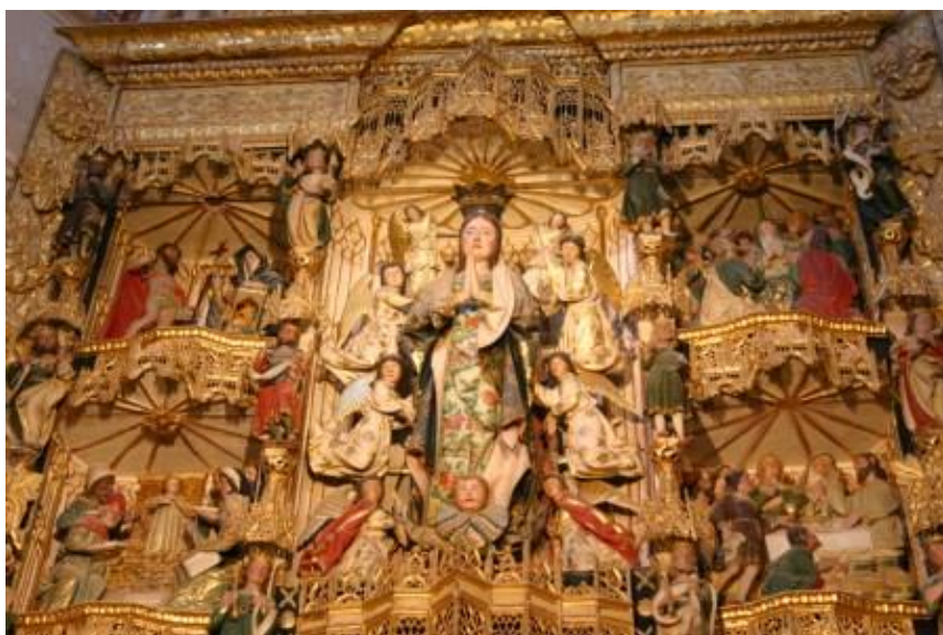
Detalle de la Capilla de la Asunción

Pero, el otro baluarte y, sobre todo, como muestra de la belleza en el estilismo puro de un Renacimiento solemne, es su Capilla de la Asunción.