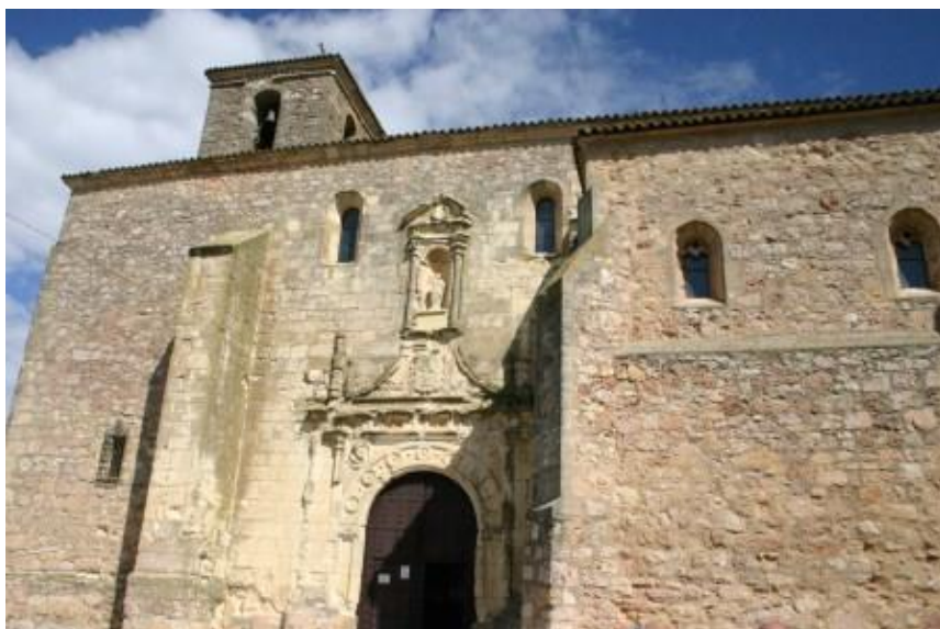
Iglesia parroquial San Pedro Apóstol de Villaescusa de Haro

Ahora bien, amigos, donde Villaescusa es bella, es desde luego en su caserío, en su arte, en su monumentalidad religiosa y civil.