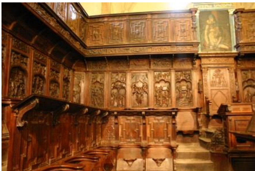
Sillería iglesia parroquial

encastra su edificación al lado del palacio de los Ramírez de Fuenleal, ahora Ayuntamiento, tal vez el palacio de ese marqués de Moscoso, la Villeta, esa Casa del Curato en piedra solemne, el convento de las Madres Justinianas con su iglesia del Santo Cristo, las ruinas del Claustro de los Dominicos o convento de la Santa Cruz, la ermita de Santa Bárbara, sin olvidar aquella fuente romana que queda y el edificio que iba a ser la primera Universidad de Castilla, iniciada como colegio por el propio obispo Ramírez y abandonado a mitad de su construcción por la ingerencia indecorosa del cardenal Cisneros. Ahí estuvo la clave de lo que hubiera podido ser este núcleo castellano.