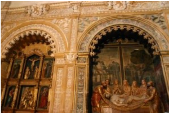
Relieves iglesia parroquial