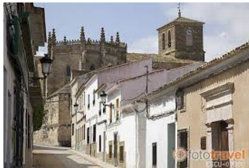
Calles de Villaescusa de Haro

Hay lugares en nuestra geografía provincial que merecen un obligado alto en el camino. En alguno de ellos, el arte alcanza el mayor contenido ornamental entrecruzado con el sentimiento religioso que abocó en tiempos de la Edad Moderna, buscando en la devoción la mayor expresión artística de los grandes hombres del Renacimiento y el Barroco. Eso lo encuentras en este lugar, Villaescusa de Haro, pueblo de los