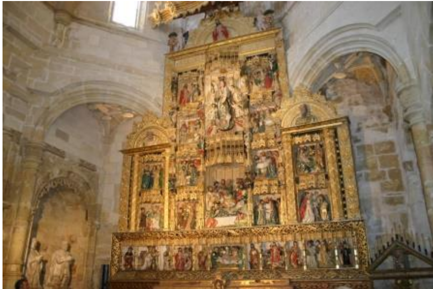
Retablo capilla de la Asunción

Para mí, Villaescusa tiene dos baluartes que abanderan su solera. El tal Astrana Marín, erudito del XIX, hombre de la literatura más profunda, crítico, prolífico traductor de obras, biógrafo de los grandes maestros universales,