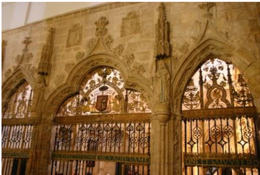
Rejas de la Capilla de la Asunción

puede pasar sin ser visitado. Es una joya de nuestra riqueza provincial, inolvidable en su visita, pues no con relatar queda así conceptuada, hay que visitarla sin excusa alguna.