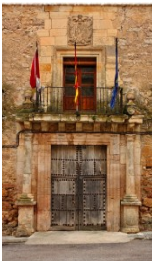
Portada del Ayuntamiento

obispos por ser cuna de numerosos prelados –diez en total- en tiempos de Don Diego Ramírez de Fuenleal, el más reconocido de todos.