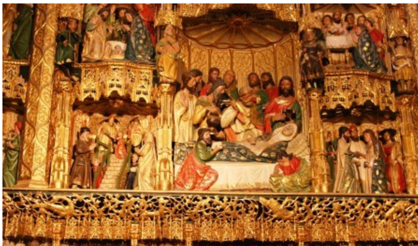
Detalle retablo Capilla de la Aunción

Para mí, Villaescusa tiene dos baluartes que abanderan su solera. El tal Astrana Marín, erudito del XIX, hombre de la literatura más profunda, crítico, prolífico traductor de obras, biógrafo de los grandes maestros universales,