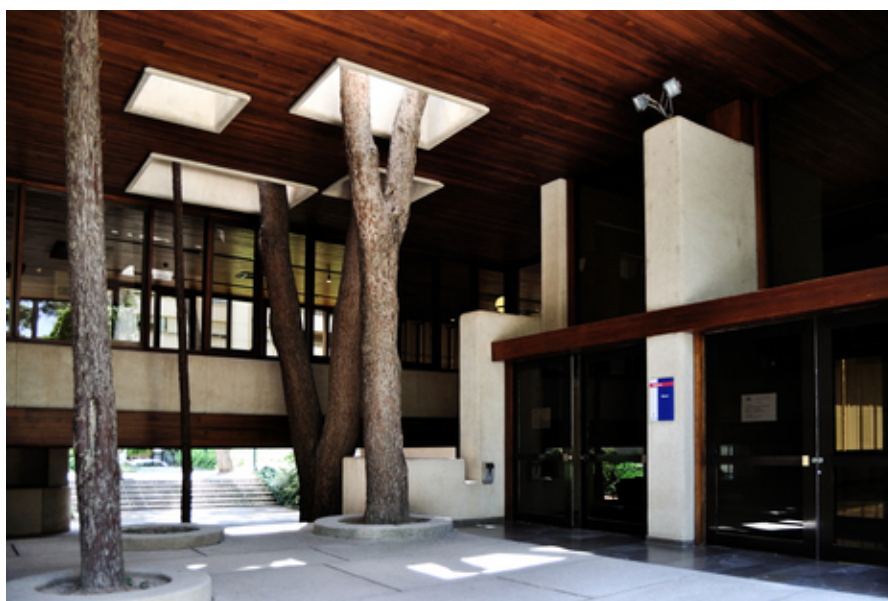
Museo de Albacete

Es harto conocido por la gran mayoría de los pensantes que la afluencia del turista, unos atraídos por su historia,