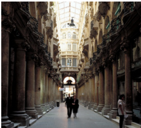
Pasaje de Lodares en Albacete

Hoy, cuando el turismo de nuestra región está principalmente motivado por su aportación cultural y artística, el viajero que llega a Albacete no sólo puede disfrutar de los siglos de historia que están representados en la arquitectura de sus piedras sino también del arte que suponen esas sus mismas piedras convertidas en ejemplos del mismo. Pasear por algunas de sus calles es recrear la vista con maravillosos edificios donde la piedra, el ladrillo, el mármol y el cristal combinan el atractivo que retiene la curiosidad más exigente y asombra a quien llega con ánimos de estéticos hallazgos.