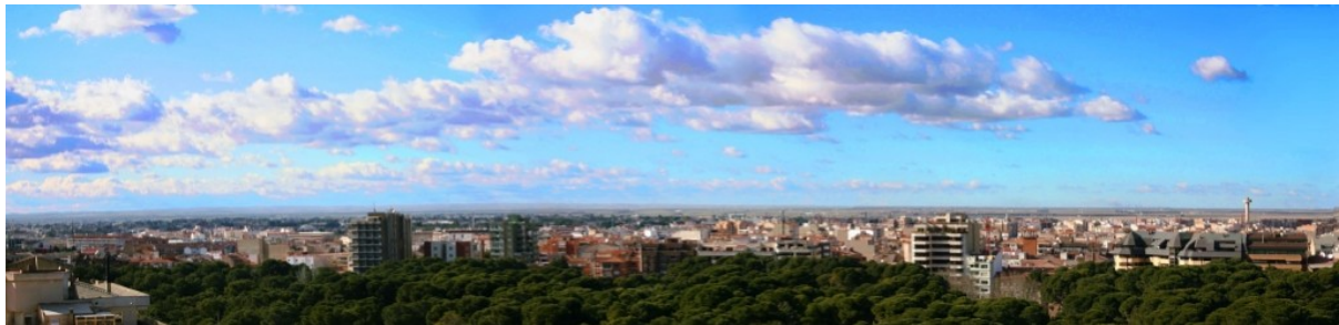
Panorámica de Albacete

gachas, el ajo de “mataero”, los guisos de caza, con especialidad de la perdiz, el atasca burras de sabroso bacalao, sus dulces de flores, los Suspiros y los Miguelitos, que pasean triunfales el nombre de La Roda... Hay que acercarse a Albacete, detenerse en ella y no tomarla de paso hacia la mar, incluso ahora cuando la cruzan veloces trenes y rápidos automóviles.