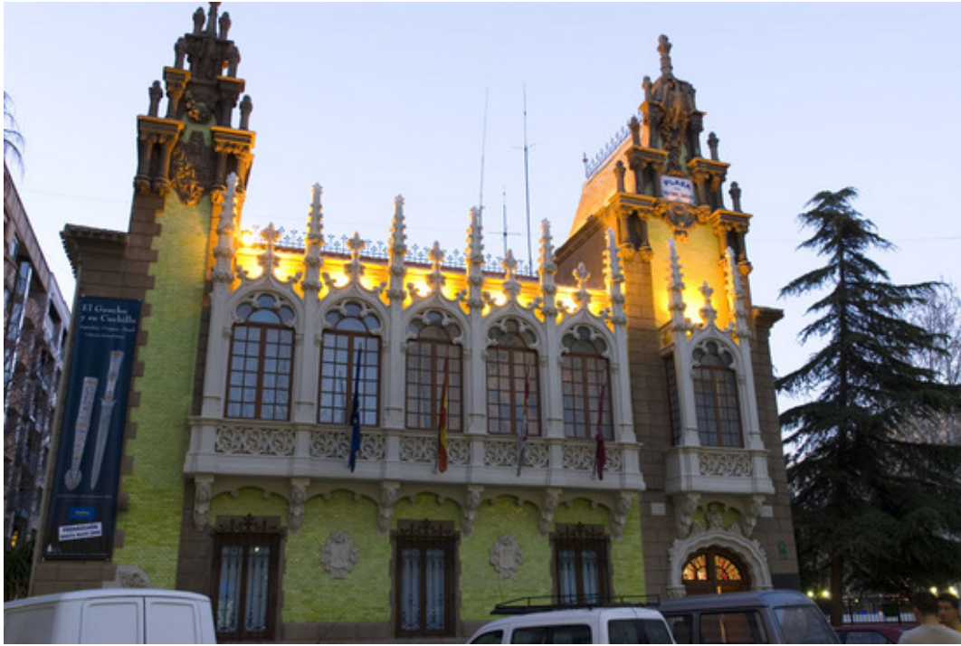
Museo de la Cuchillería de Albacete

De las hoy cinco capitales de provincia que integran la Comunidad de Castilla-La Mancha fue la de Albacete la que hace unos decenios tuvo el mayor crecimiento demográfico, doblando a unas y triplicando a otras de sus hermanas regionales. Ciertamente tampoco se pueden olvidar los años de la España emigrante y, sobre todo sus habitantes de sus pueblos tomaban trenes con destino al próximo levante. Pero hoy hablamos de la capital. Quizá porque su crecimiento le venía desde la raíz histórica y su unión a la región murciana, su recuperación le