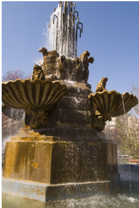
Fuente de las Ranas en

fue más fácil y pronta que a las demás. Eso hizo que se convirtiera en la más poblada y vital de las cinco hoy capitales castellano-manchegas y que aún, cuando estos últimos años, por razones de ubicación en la administración política, como es el caso de Toledo, o en la asignación de otros factores de progreso, llámense AVE o la propia extensión de la Universidad, tal sucede con Ciudad Real, estas hayan crecido recientemente a un ritmo superior, pero sin llegar nunca a esa extensión demográfica a que hacemos referencia de principio.