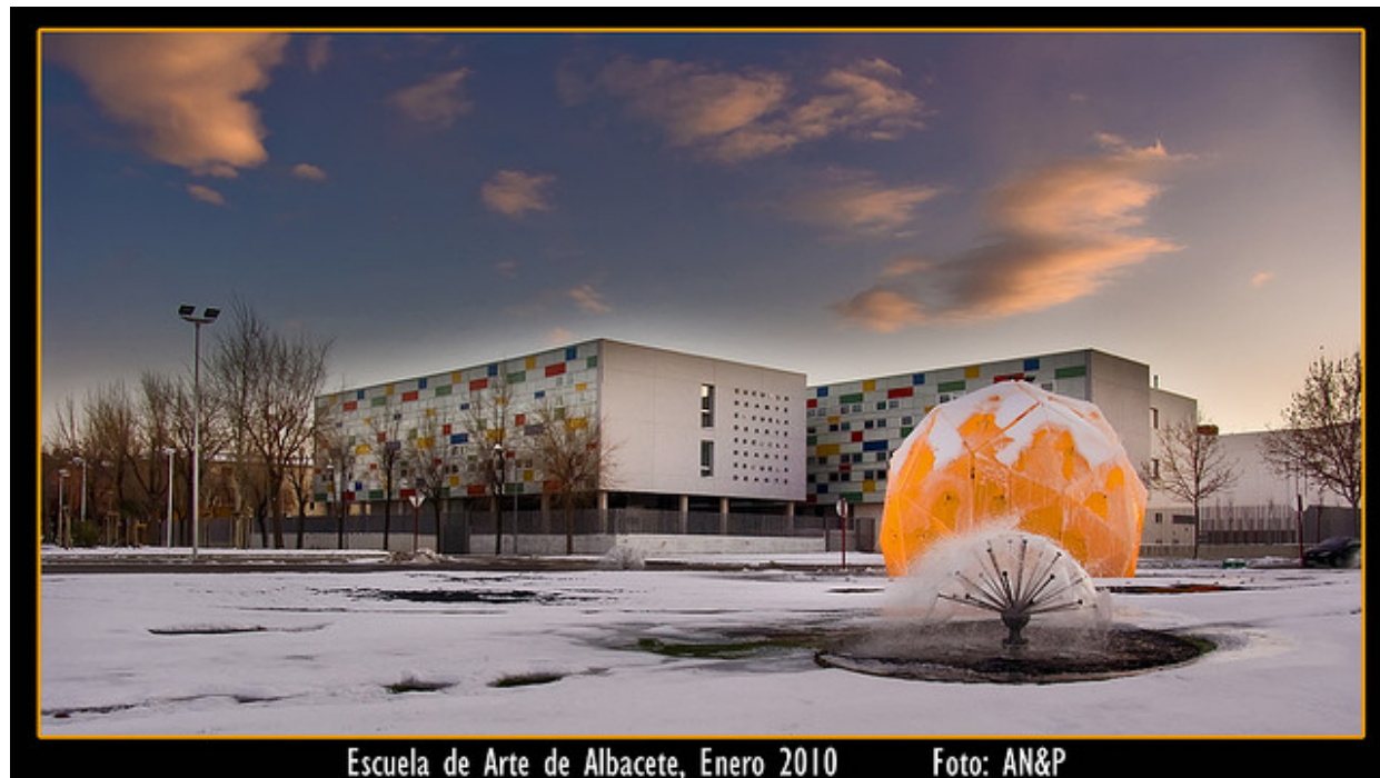
Escuela de Arte de Albacete, Enero 2010