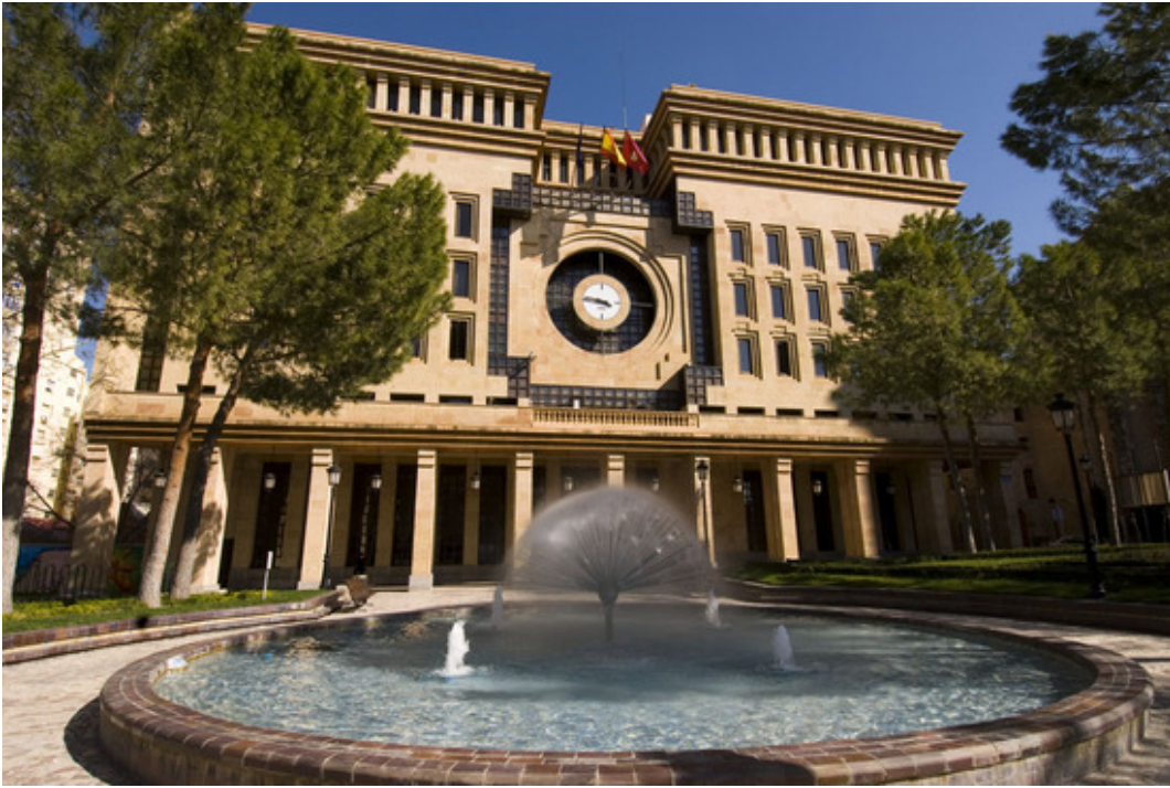
Ayuntamiento de Albacete

Y no digamos quienes, en momentos de calurosos estíos llegan a su magnífico Parque y capaces son de paliar las furias de Febo bajo las sombras de su variada y corpulenta arboleda.